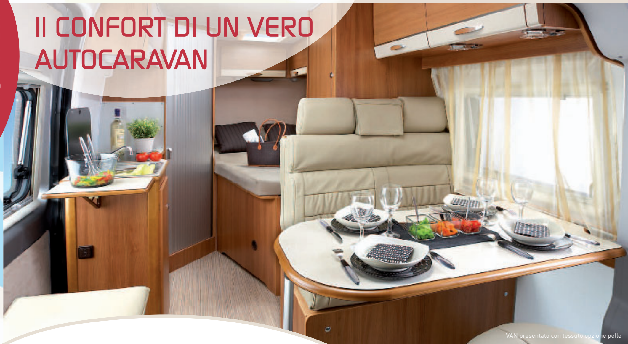
VAN presentato con tessuto opzione pelle

Da più di 50 anni di esperienza nella costruzione di autocaravan, RAPIDO sfrutta tutto il suo know-how in questo nuovo VAN. Il suo guscio in poliestere sposa le più piccole forme interne (isolamento specifico) e permette in questo modo di ingrandire lo spazio. Il risultato è confortevole e funzionale: uno spazio di circolazione perfettamente calcolato ed una disposizione ottimale dei 4 spazi di vita. Approfittate anche di un grande salone a 5 posti conviviale, di una cucina, di 4 posti letto (2 bambini) e di una vera toilette. I mobili HARMONY portano un vento di freschezza all'interno. Aggiungete il vs tocco personale e scegliete uno dei tre tessuti in opzione. Nel momento in cui poserete piede sul gradino elettrico del vostro VAN, vi sentirete subito a casa vostra.