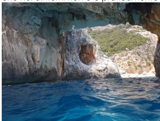
L'arco di Cala Goloritzè

per tornare a casa (questa è sempre un'altra storia!), ci dobbiamo avvicinare ancora di più ad Olbia, passando la serata a San Teodoro . PS perfetto per la notte e vicino al centro in via Cattin (a pagamento dalle 18.00 alle 2.00, 4€ per 6h), sono le 23.00 ma San Teodoro è talmente piena di turisti che qualcuno ci farà mangiare anche a quest'ora! Osteria del mar Griglieria , la cameriera merita una citazione per la professionalità e la vitalità dimostrata nonostante l'orario, la grigliata di pesce è buonissima, il vino ottimo e il conto è proporzionato alla zona e alla qualità del pesce; il mirto ovviamente non può