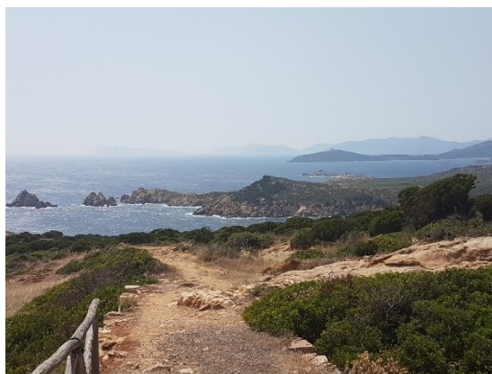
Vista dal Faro di Capo Spartivento