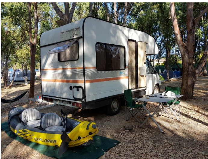
Il nostro "Parco giochi" su ruote

03-07 Siamo arrivati a quello che pensiamo essere il nostro ultimo giorno, e visto che siamo a San Teodoro decidiamo di fare un giro a Lu Impostu , comoda per il parcheggio (gratuito) e non troppo affollata; rientriamo alle 15.00 per una doccia e per avviarci verso Olbia dove vorremmo fare un po' di shopping prima della partenza. Al momento di mettere in moto mi rendo finalmente conto che il traghetto per il ritorno lo abbiamo il giorno 4, cioè domani!! Sono proprio scemo, anche perché a questo punto siamo senza acqua e con le grigie piene!! Avevo calcolato tutto così bene, però alla fin fine abbiamo un giorno in più di vacanza non è che ci è andata proprio male! Vicino a San Teodoro troviamo un'area attrezzata che fa al caso nostro, Camping Cala d'Ambrà (25€ con tutti i servizi, piazzole tutte all'ombra, personale molto gentile) la spiaggia non è il massimo ma il camper è parcheggiato letteralmente a 20mt dal mare, quindi è il momento di tirare fuori il Kayak e di visitare le spiagge nei dintorni ( La cinta, Isuledda ); per il momento facciamo un giro esplorativo anche perché è tardi e ho già montato il BBQ portatile perché stasera si griglia la tipica salsiccia sarda. Una birra e si va a dormire.