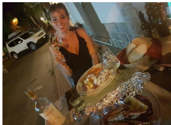
La Fabi e la cena!