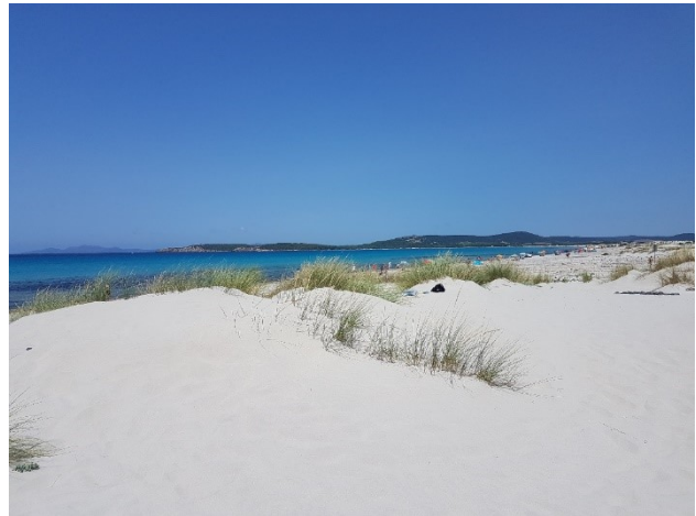
Le Dune di Porto Pino