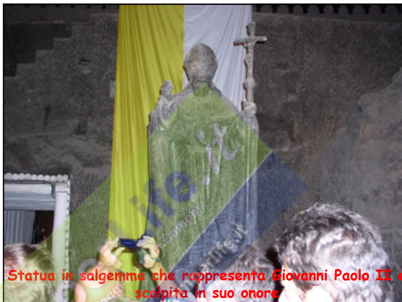
Statua in salgemma che rappresenta Giovanni Paolo II e scolpita in suo onore

Ripartiamo verso le 15.30 per Wadowice, città natale di Giovanni Paolo II. Parcheggiamo in centro a pochi passi dalla Basilica e dalla Casa Natale del Papa. L'ingresso alla Casa è dalle 9.00 alle 17.45 (ingresso gratuito). Noi arriviamo alle 17.50 e se non fosse stato per la bontà di una suora custode, non avremmo potuto entrare. Invece ci apre e possiamo così calpestare il suolo che anche Carol Woityla calpestò. Visitiamo brevemente la Basilica e poi ripartiamo verso Auschwitz. Parcheggiamo di fronte all'ingresso del Museo per 20 zł 24 ore + 6 zł per caricare l'acqua.