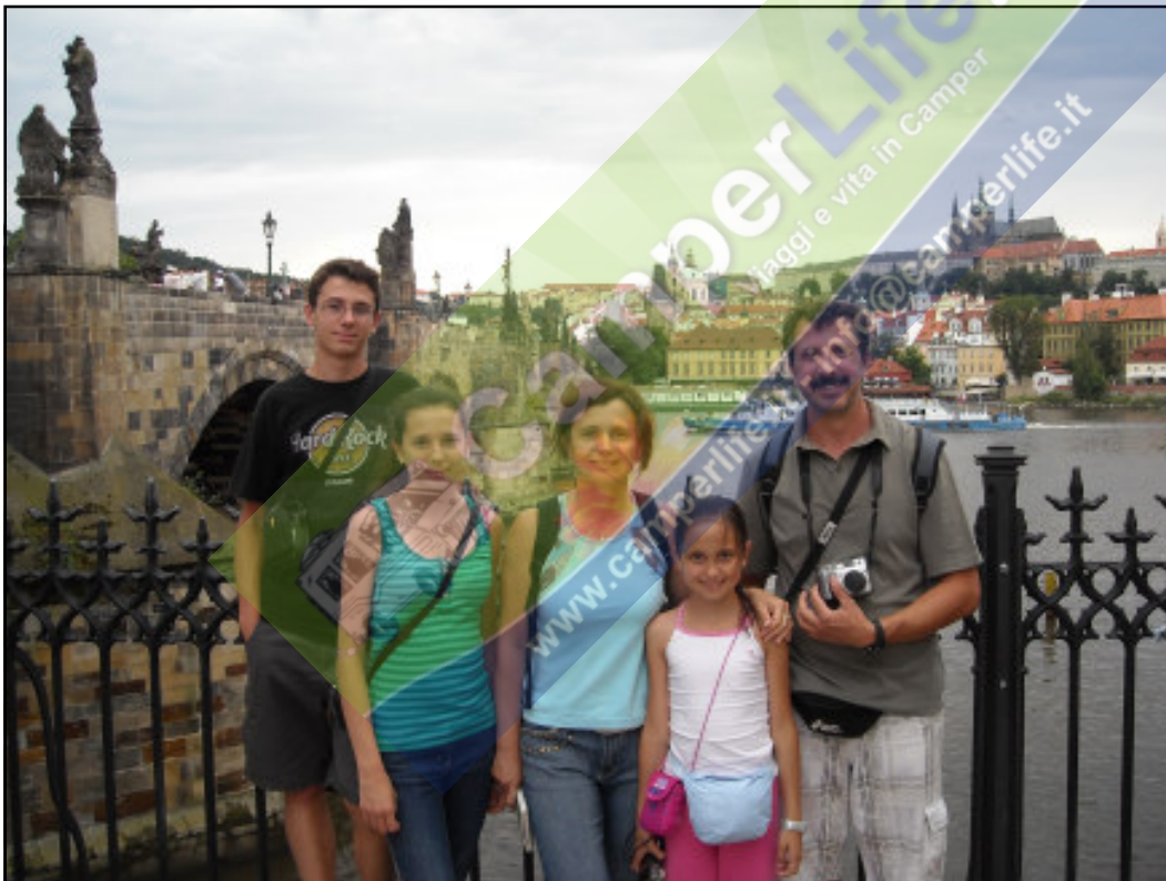
Il Ponte Carlo sulla Moldava e il Hrad sullo sfondo

Scopriamo che è chiuso, così, seguendo le indicazioni del tomtom, ci dirigiamo verso un altro campeggio del quale siamo venuti a conoscenza grazie ad un cartello affisso all'ingresso del campeggio chiuso. Anche questo si chiama "Caravan Camp", ma si trova via Cisarskà Louka. Si trova su un'isola della Moldava a circa 500 m. dalla fermata del tram per il centro. Il Campeggio è ben tenuto e bello perché è proprio sulla riva del fiume in un punto molto panoramico; la ragazza della reception parla un semplice italiano, o comunque l'inglese (1700 Kr per due notti). Arriviamo, dopo esserci sistemati, nel centro della città tramite il tram numero 20, anche se è raggiungibile pure con le linee 12 e 14. Passeggiata sul Karluv Most (Ponte Carlo), lungo la Karlova fino alla piazza Staromestskè Namesti. Troviamo anche lì vicino il classico