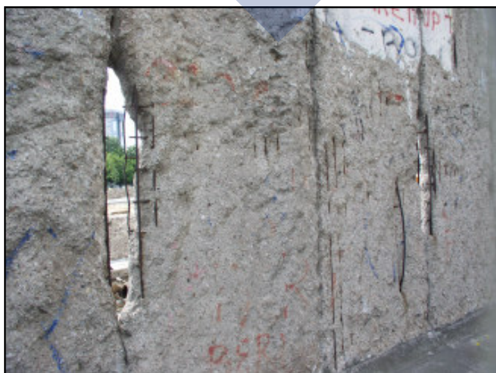
Un pezzo del Muro rimasto