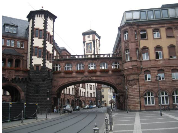
Romer il municipio

Da vedere la Paulskirche, il Kaiser Dom e la torre della Commerzbank alt 259 m