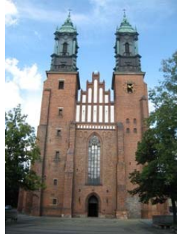
San Pietro e Paolo