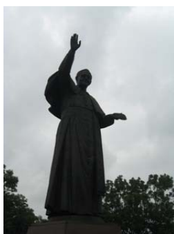
Genitori di Giovanni Paolo II