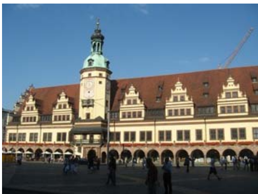
Municipio di Lipsia

Durante la passeggiata ci lasciamo tentare da una gelateria italiana che fa dei gelati veramente ottimi, alla faccia della dieta che va in vacanza anche lei, pazienza vorrà dire che faremo una cena leggera.