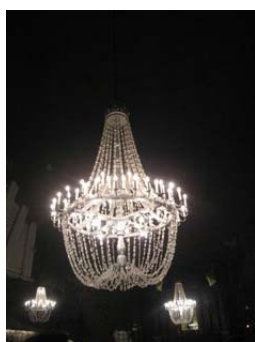
Wielicka Miniera di sale

Nel pomeriggio,dopo aver pranzato in un ristorante Georgiano,piatti veramente abbondanti e squisiti, per €24,prendiamo il pulmino che in una mezz'ora ci porta alla Miniera di sale (Wieliczka) L'entrata è un po' cara, €60, ma non conviene perdersi questa visita, perché è veramente bella. Alle 19.30 siamo di nuovo in camping stanchi, ma soddisfatti.