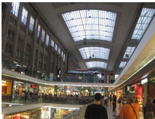
stazione di Potsdam

Domenica 3 Agosto Germania Brandeburg und Berlino