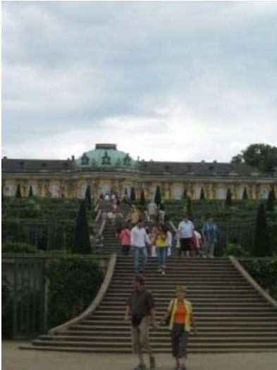
Parco Sanssouci Sinagoga