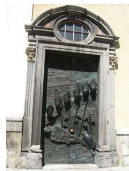
Rocca del castello