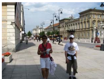
la via Reale