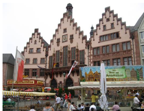
Romerberg Piazza centrale