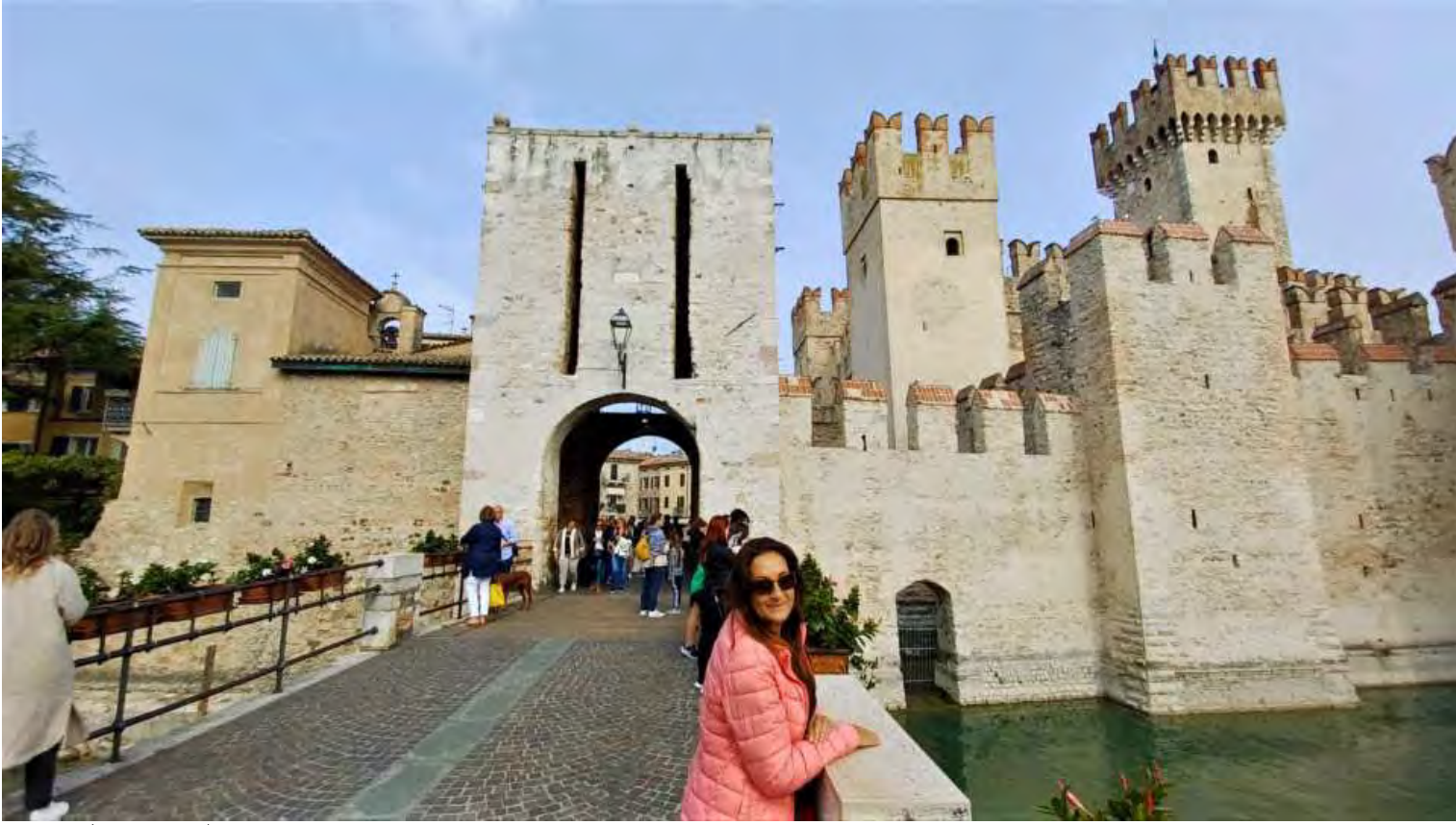
Entrata al centro storico

Il castello scaligero di Sirmione è una rocca di epoca scaligera, punto d'accesso al centro storico di Sirmione. Si tratta di uno fra i più completi e meglio conservati castelli d'Italia, oltre che raro esempio di fortificazione lacustre marina.