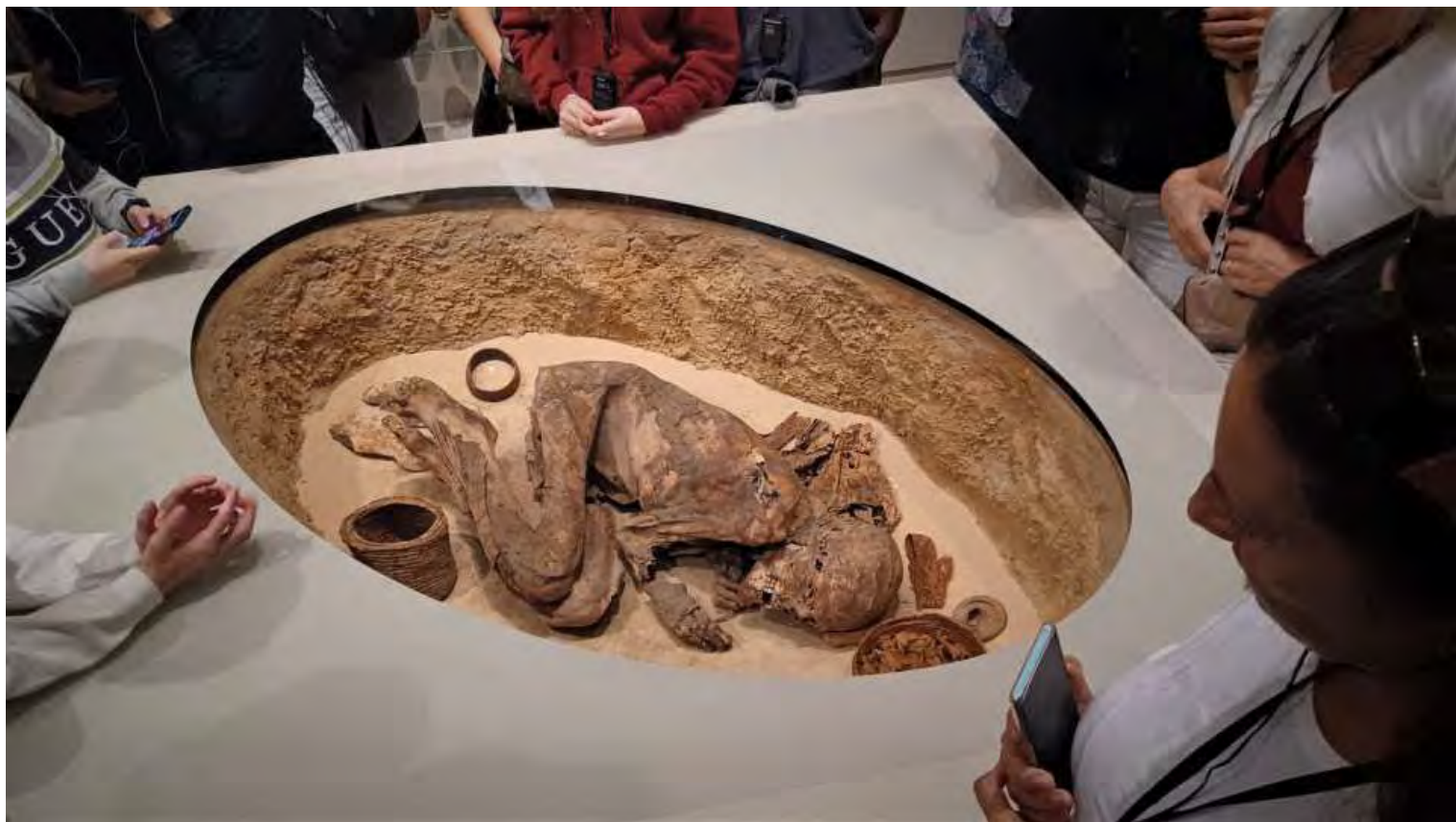
Una delle prime mummie rinvenute nel deserto

Nel pomeriggio, visitiamo il Museo Egizio avvalendoci di una guida che ci illustra ciò che vediamo ma un po' di fretta. La visita guidata dura circa due ore e mezza, da soli avremmo visto qualcosa di più e più in dettaglio ma saremmo arrivati alla chiusura.