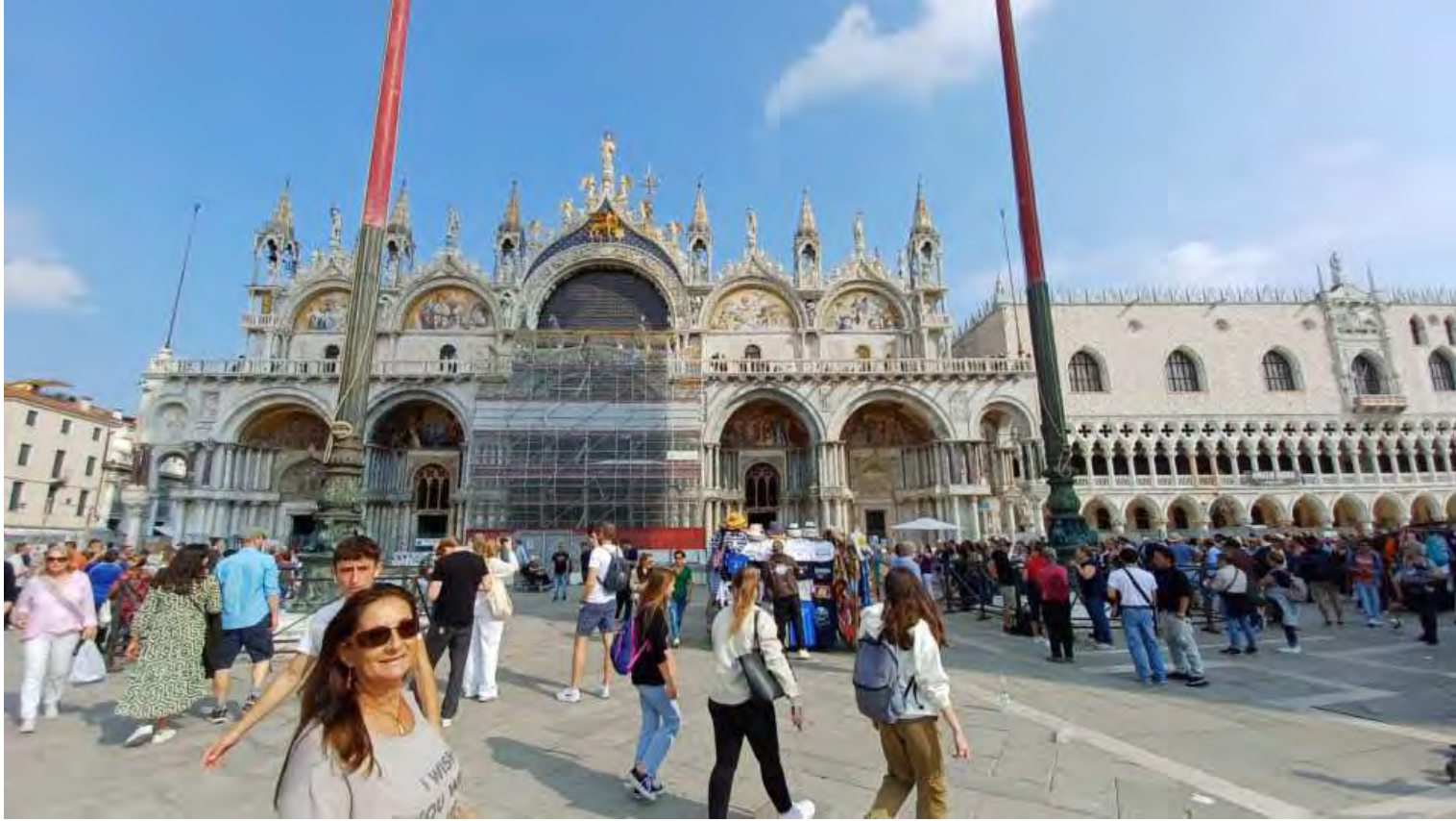
Facciata della Basilica di San Marco che sfortunatamente per noi era in restauro