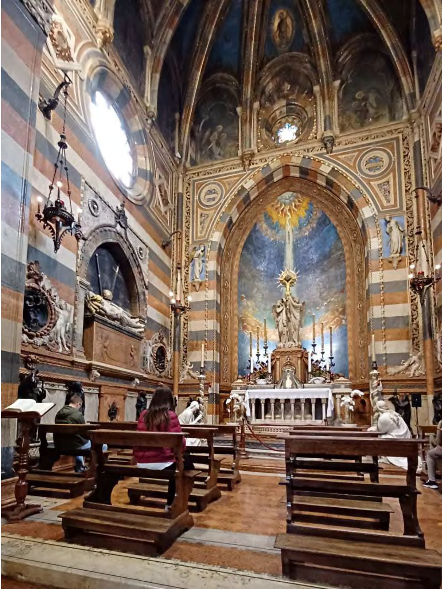
Cappella del Santissimo Sacramento

Dopo la visita alla Basilica, un bell'aperitivo nella piazza del Santo