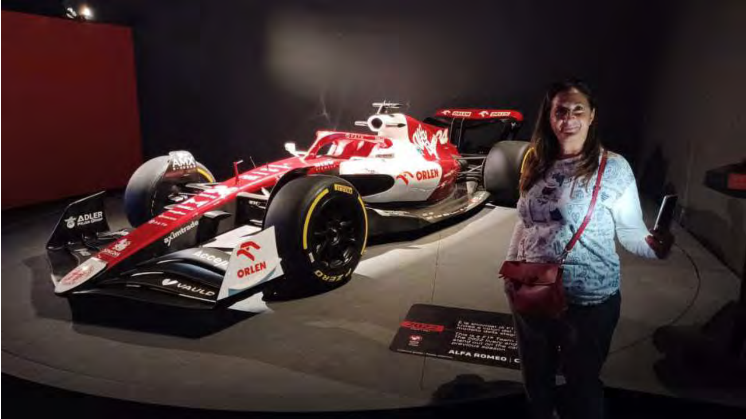
Fino ad arrivare alle attuali monoposto di F1