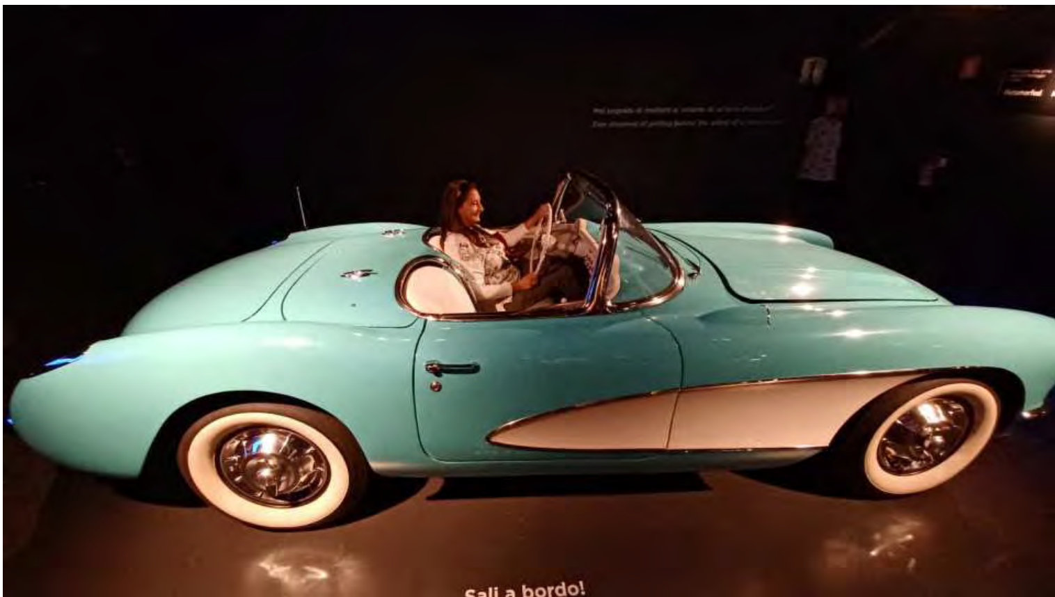
Per passare poi alle auto della Dolce Vita Americana con la Chevrolet Cabriolet del 1957