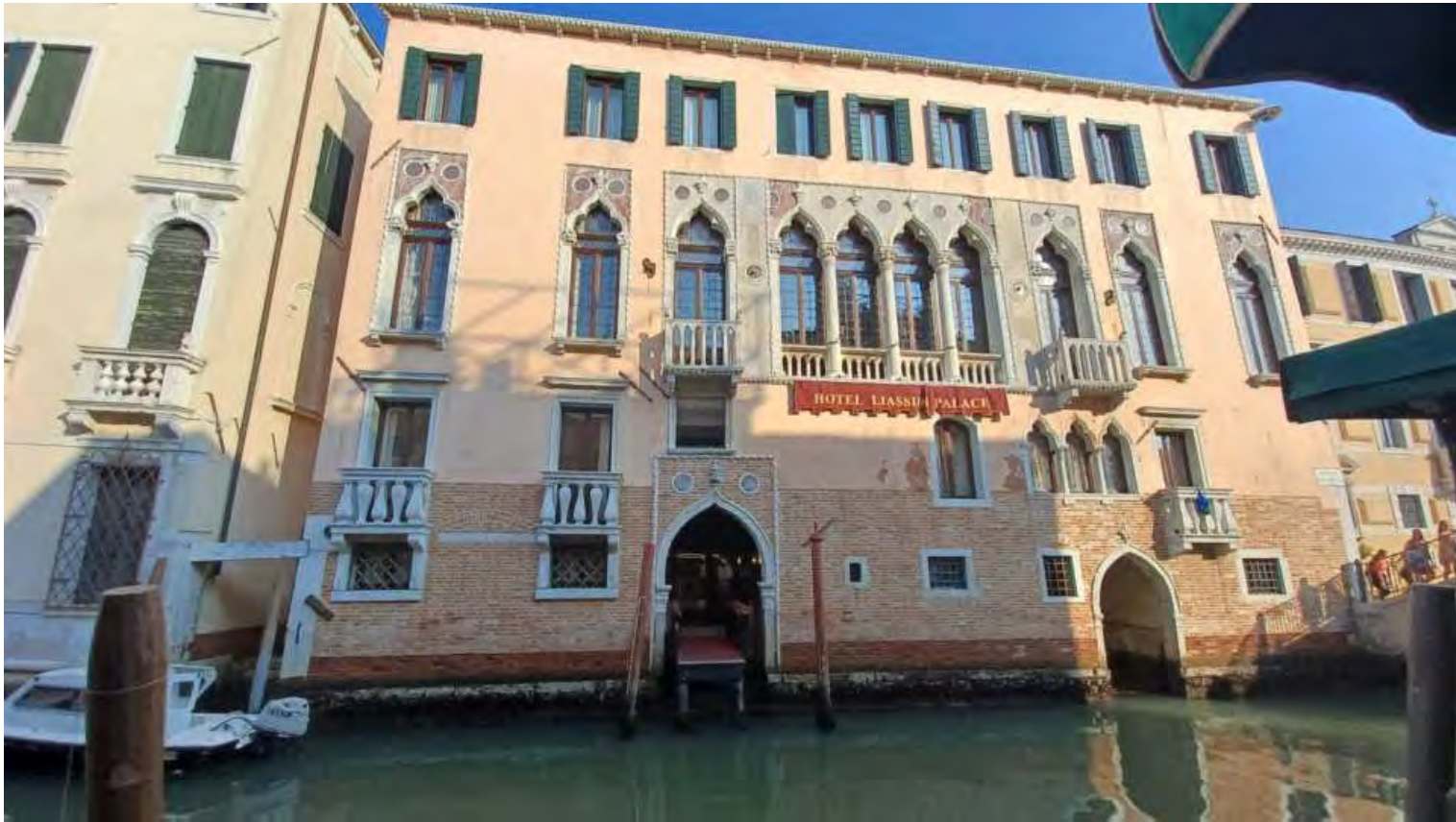
Case e Alberghi con accesso diretto sull'acqua