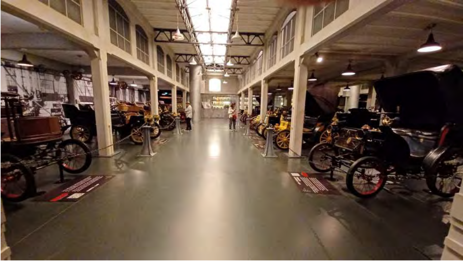
Si parte dalle prime carrozze a motore