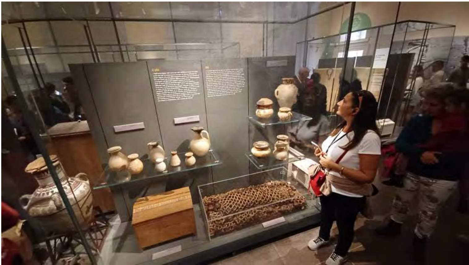
Oggetti contenenti viveri che servivano al defunto per raggiungere il regno dei morti