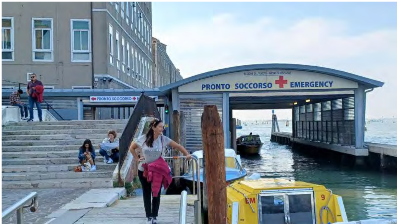
Pronto Soccorso e ambulanze sull'acqua, abbiamo assistito all'arrivo di un'ambulanza acquatica con tanto di sirene e lampeggianti