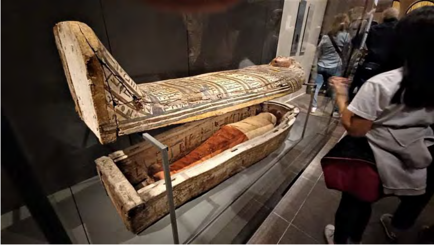
Sarcofago con la mummia all'interno