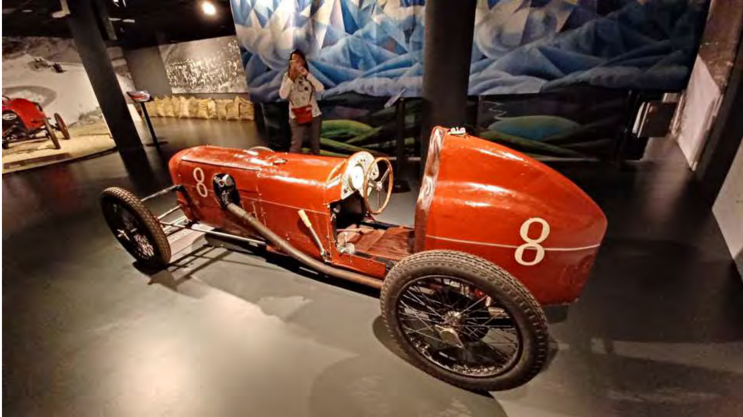
Dalle prime sportive da gara