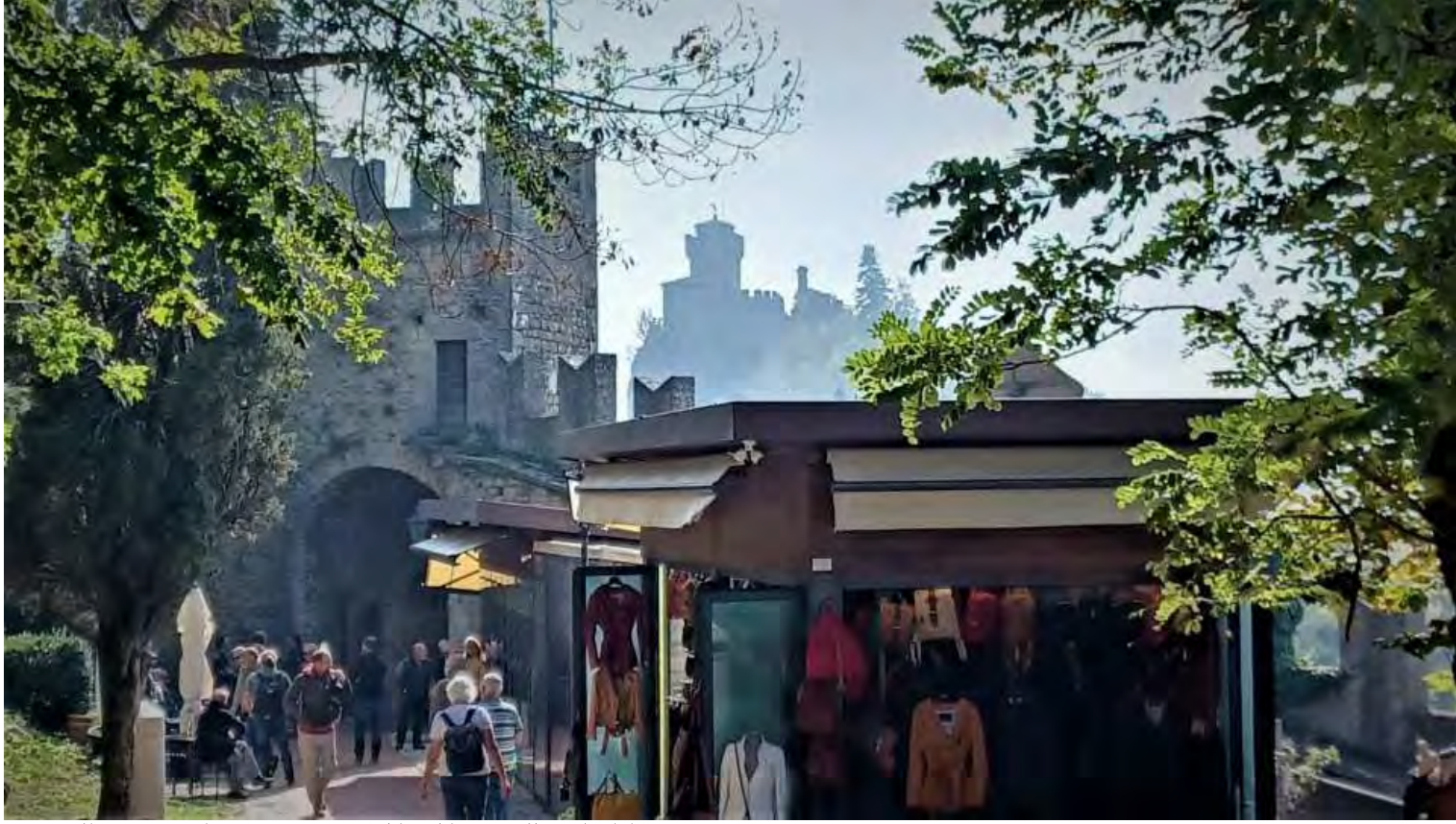
In tutto il centro storico non mancano chioschi con pelletterie del posto