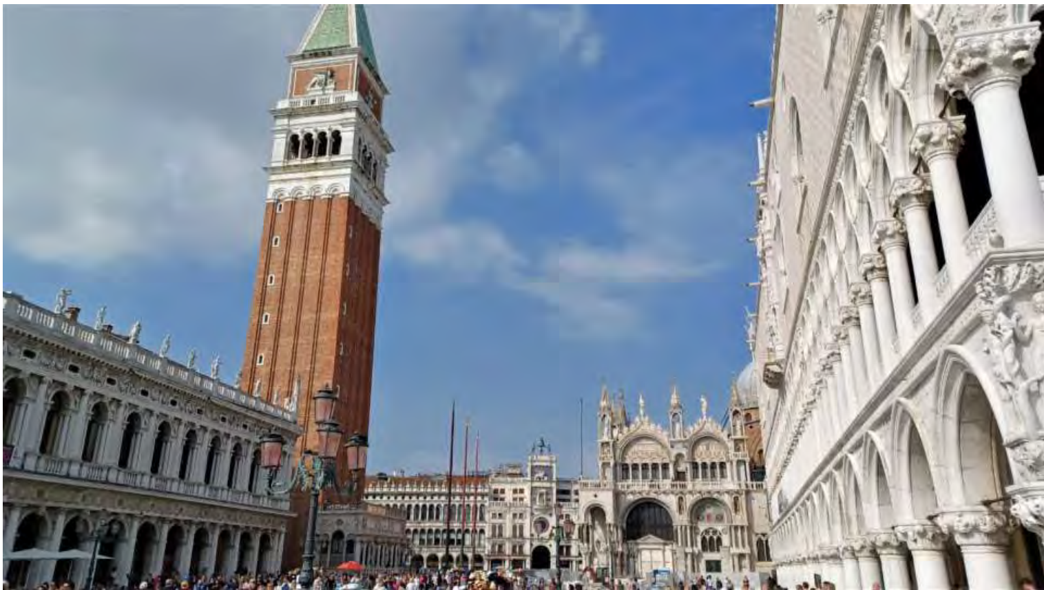
Campanile di San Marco, detto Il padrone di casa

Ci rimettiamo in marcia in direzione del molo dove dobbiamo riprendere il Taxi Boat per tornare al camper. Lungo il percorso, Venezia ci regala una sorpresa tanto inaspettata quanto emozionante. Ormeggiata al molo in prossimità del Museo Storico Navale, sulla Riva San Biagio, ecco spuntare il Vanto della Marina Militare Italiana, la nave scuola Amerigo Vespucci in tutto il suo splendore