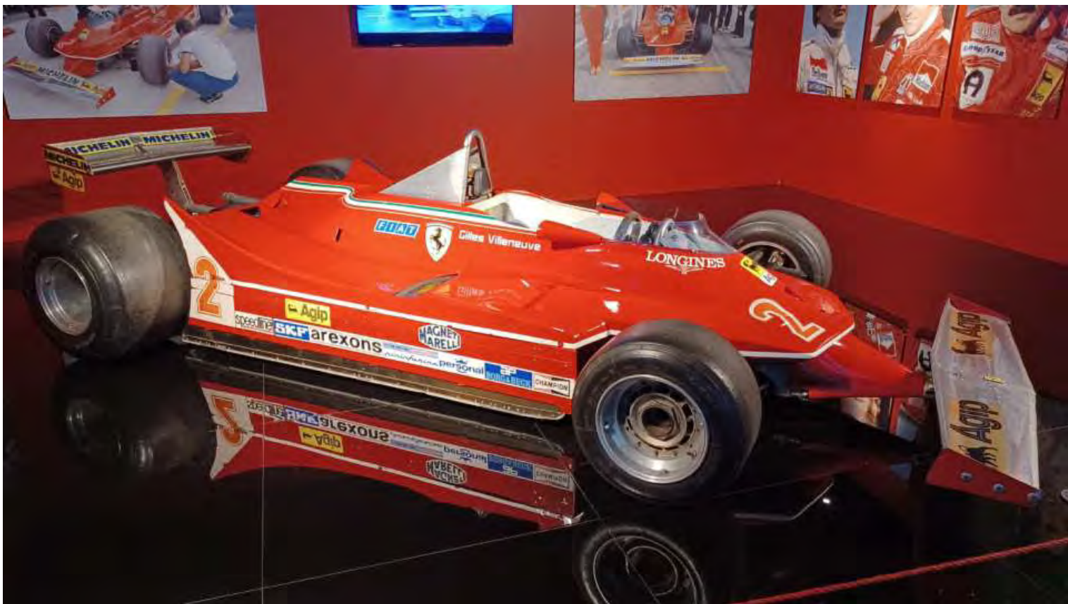
Alle auto che hanno fatto la storia della F1