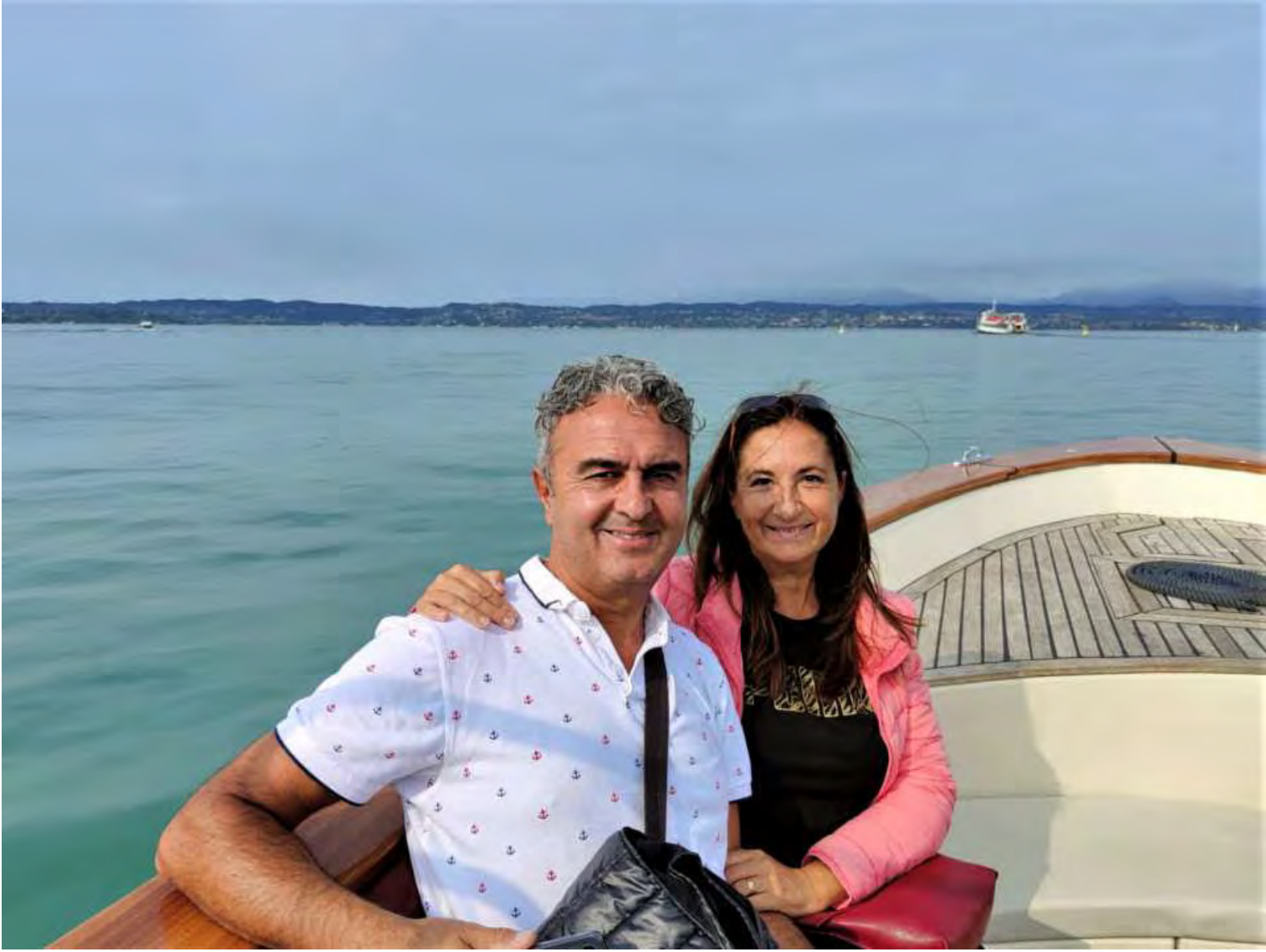
Dalla barca ammiriamo parte della costa di Sirmione con le Grotte di Catullo