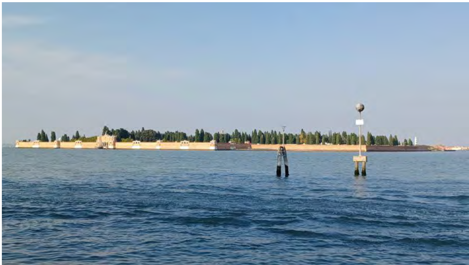
Anche l'ultimo viaggio avviene via mare. In questa foto il cimitero monumentale di San Michele voluto da Napoleone nel 1810 quando il preesistente cimitero sull'isola di San Cristoforo risultò troppo piccolo, venne interrato il canale che lo divideva dall'isola di San Michele formando così una unica grande isola destinata a divenire il cimitero della città diviso in tre aree, cattolica, ortodossa ed evangelico

Cammina cammina, arriviamo al Ponte di Rialto, il più antico dei quattro ponti che attraversano il Canal Grande. Il ponte fu commissionato nel 1588 all'Architetto Antonio Da Ponte, unico ad aver proposto il progetto ad unica arcata. E l'opera fu portata a termine nel 1591