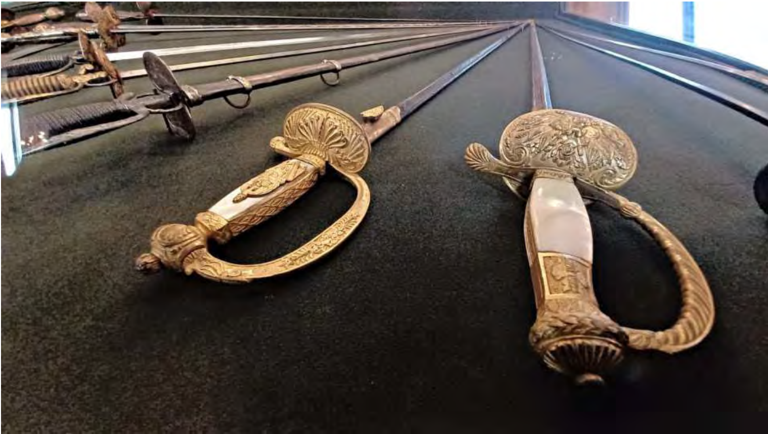
Museo delle armi Reali