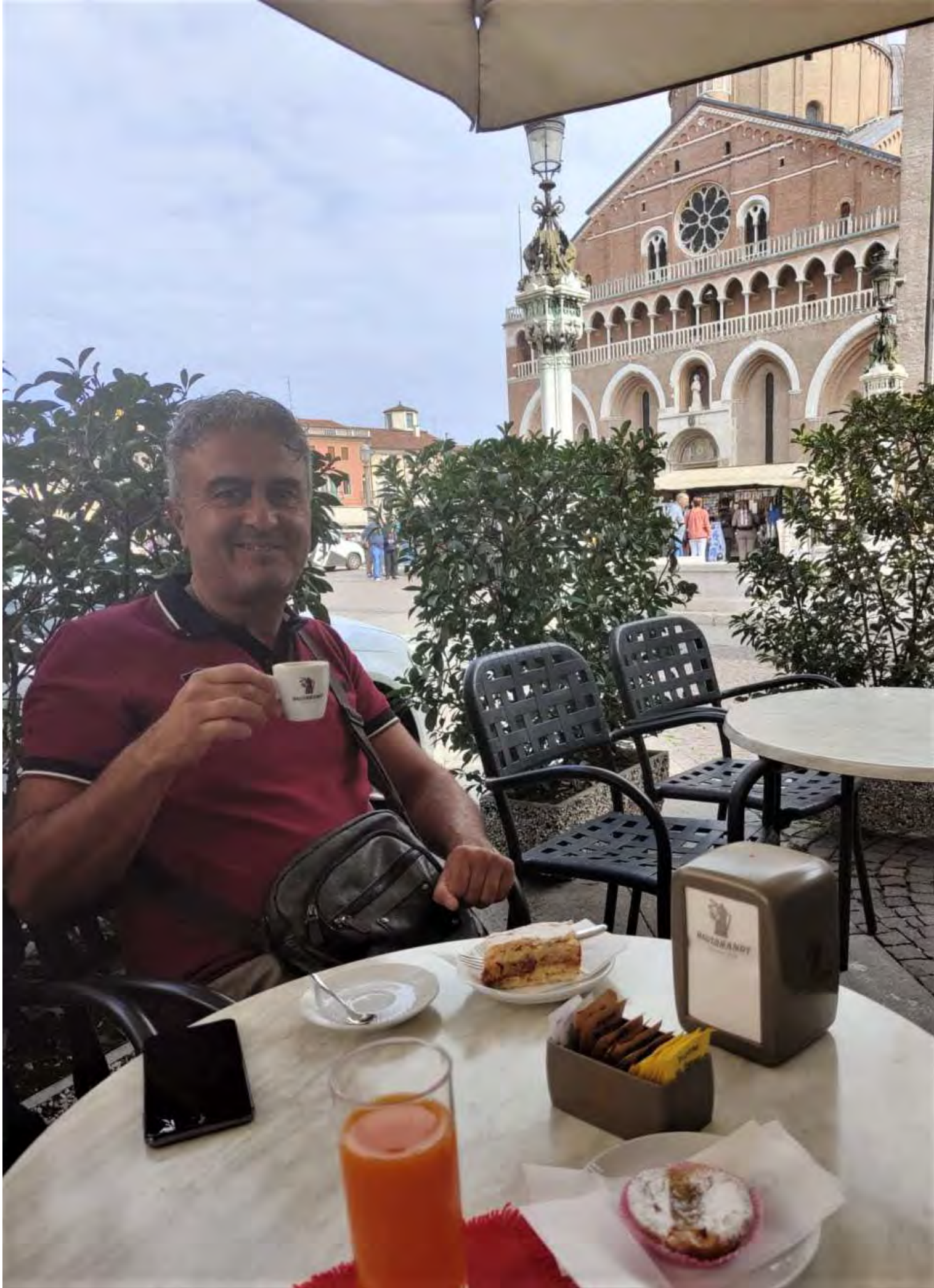
Rifocillati, riprendiamo, stanchi ma determinati, la nostra passeggiata nel centro di Padova con una sosta fotografica al Prato della Valle, altro simbolo di Padova. È una delle piazze più grandi e suggestive d'Europa, seconda solo alla Piazza Rossa di Mosca. E' in realtà un grande spazio verde circondato da un fossato contornato da 88 statue di grandi personaggi dell'epoca delle quali 10 sono mancanti