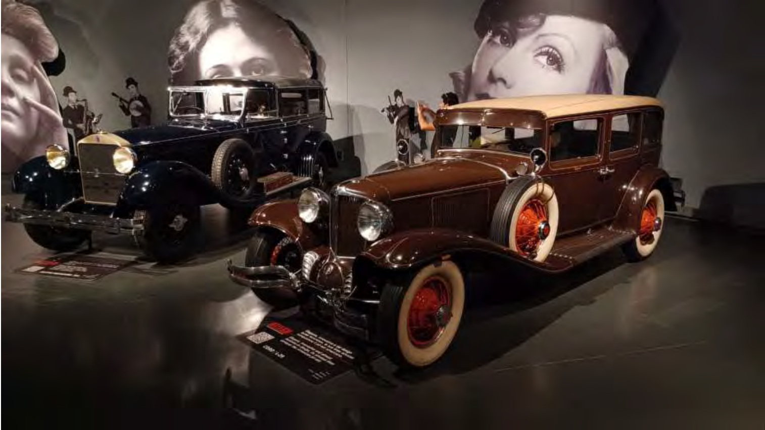
Alle auto dei Gangster