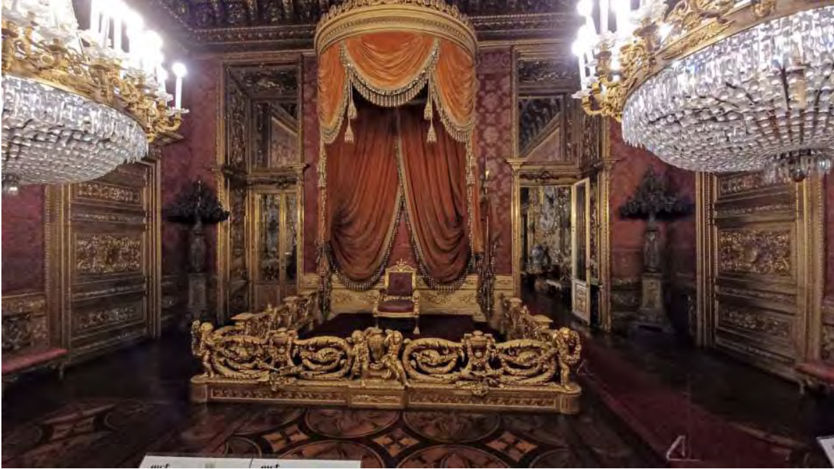
Sala del Trono