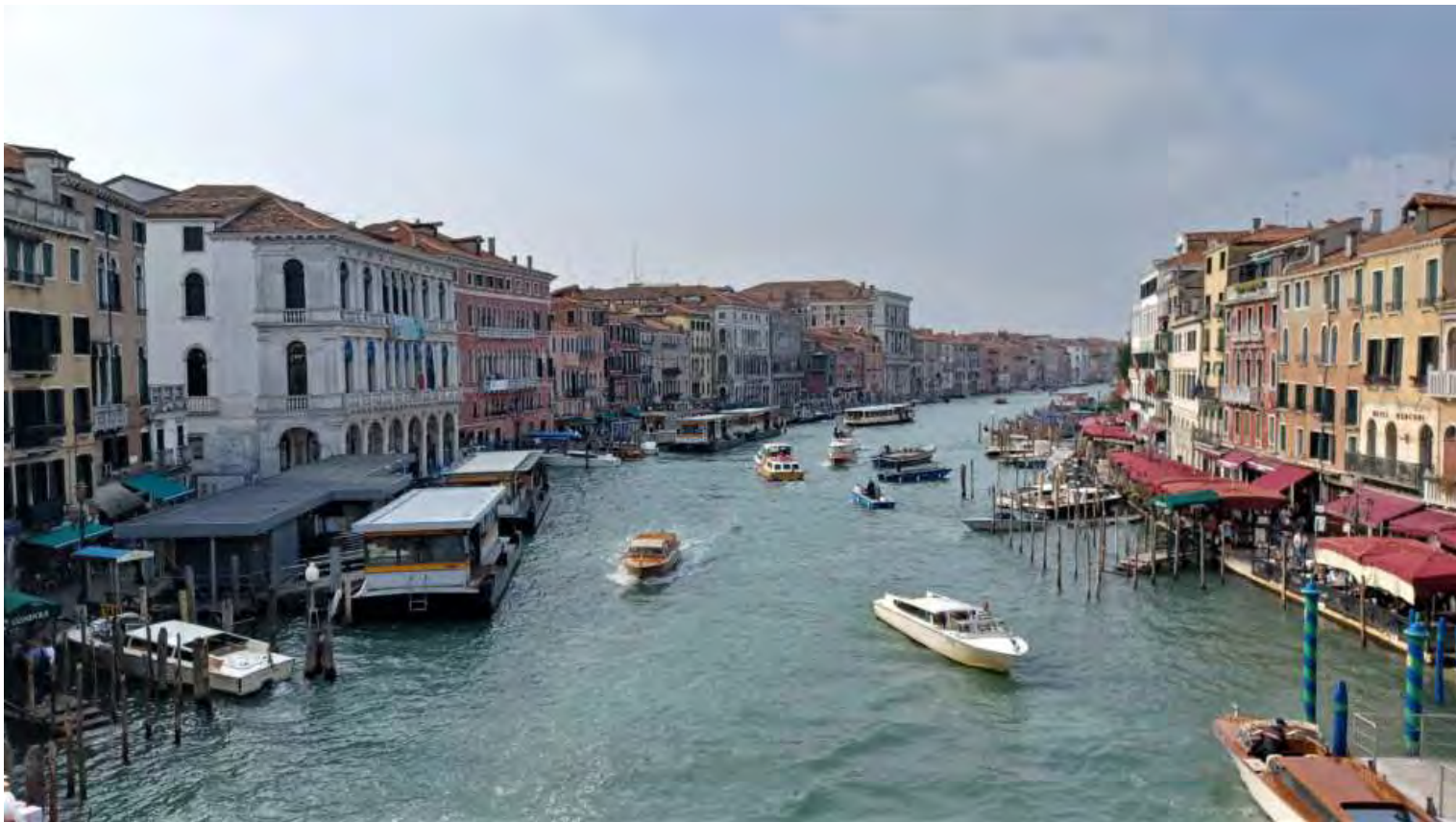
Suggestivo panorama sul Canal Grande osservato dal Ponte di Rialto

Passato il ponte, percorriamo un altro mezzo chilometro e in 10 minuti raggiungiamo Piazza San Marco, nota anche come il Salotto d'Europa per la sua bellezza architettonica. Sulla piazza a forma trapezoidale lunga 170 metri, si affaccia la Basilica di San Marco con facciata in marmo del XIII secolo; il campanile di San Marco, chiamato affettuosamente dai Veneziani El paron de casa che sfiora i 100 metri di altezza; la Torre dell'Orologio dalla quale parte la Merceria, calle caratterizzato da numerosi negozi.