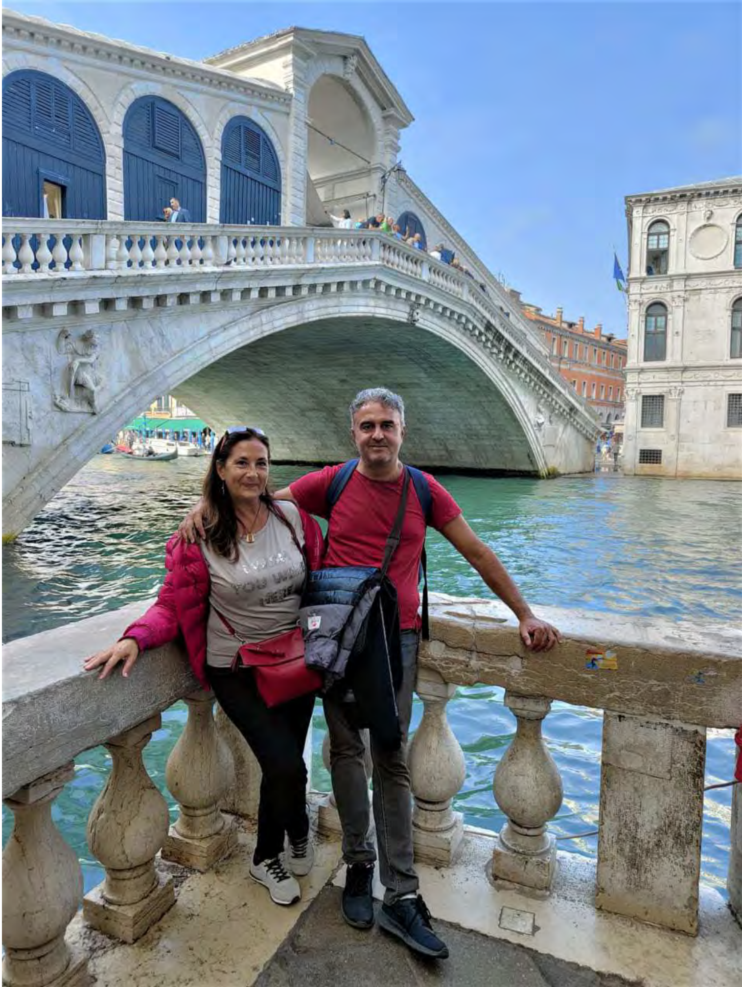
Saliti sul ponte, che ospita diversi negozi di souvenir, si ammira uno spettacolare paesaggio sul Canal Grande