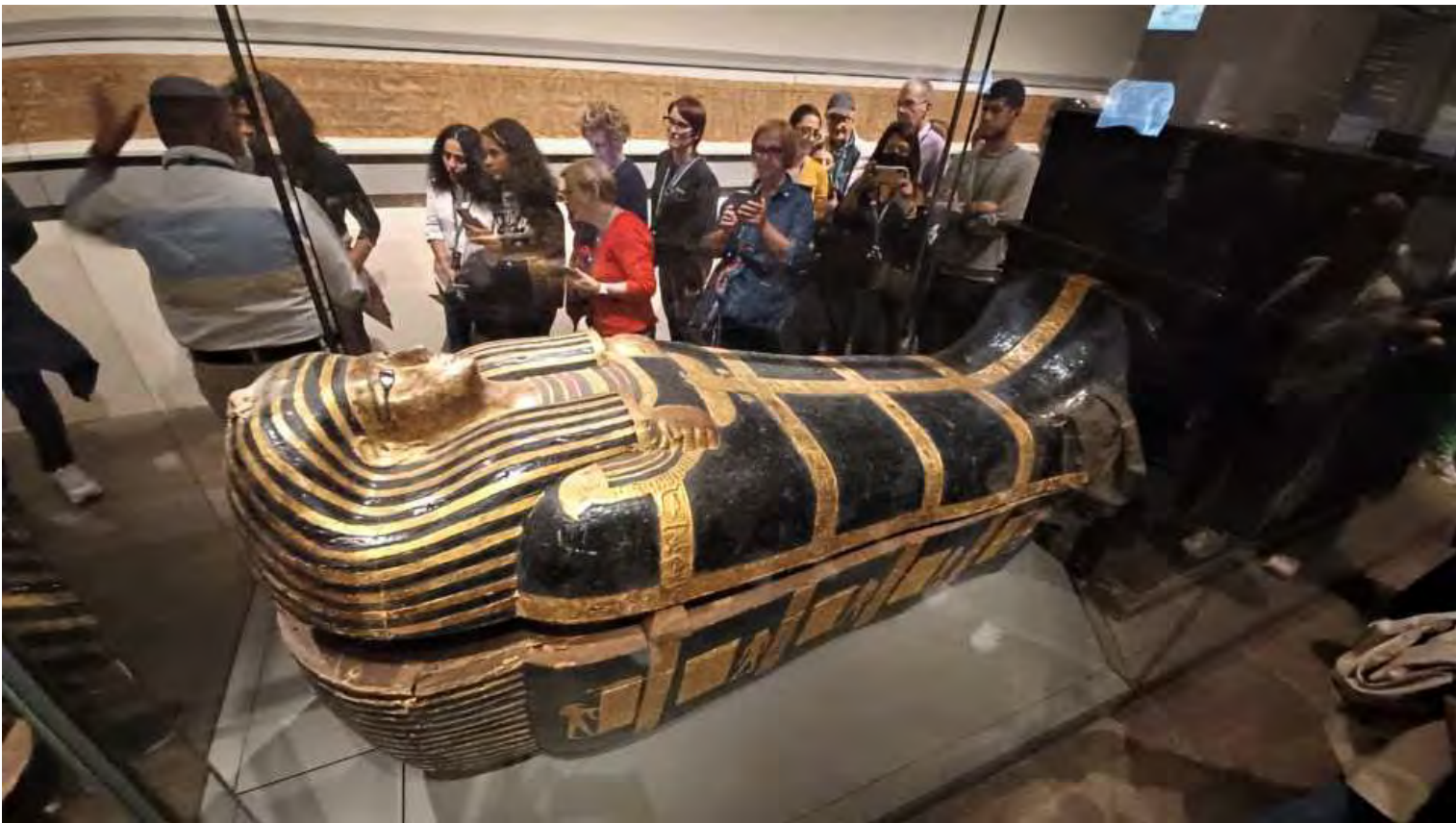
Maggiore era l'importanza in vita del defunto e superiore era la decorazione del sarcofago