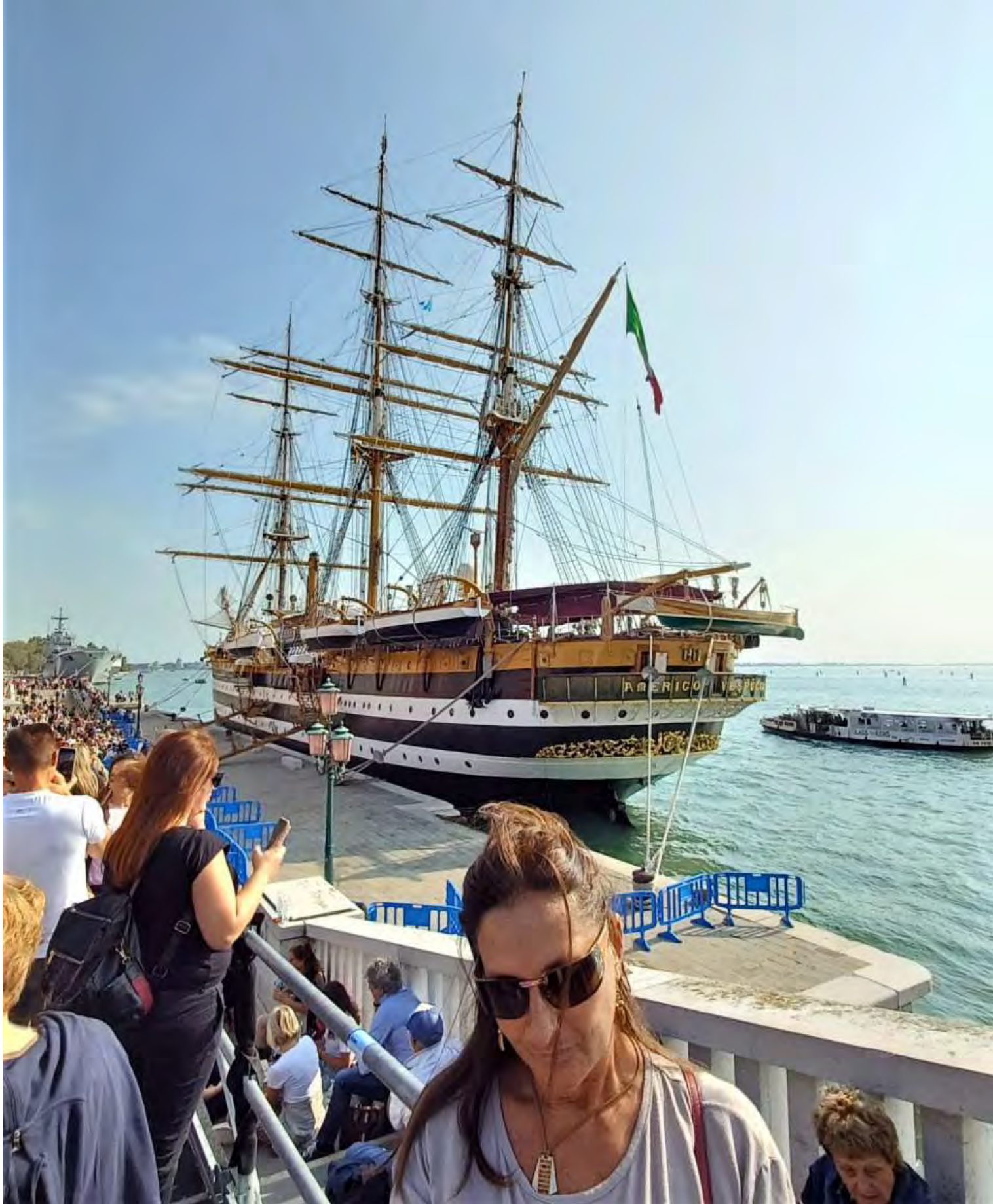
L'Amerigo Vespucci è un veliero della Marina Militare, costruito nel 1931 come nave scuola per l'addestramento degli allievi ufficiali dei ruoli normali dell'Accademia navale di Livorno.