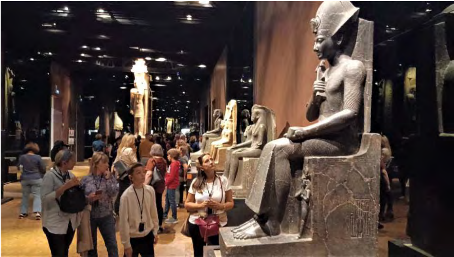
Il Faraone Ramses II che morì all'età di 94 anni dopo 66 anni di Regno. E' stato il Regno di massima gloria dell'antico Egitto

Usciti dal Museo Egizio torniamo al Camper stanchi morti, cena, TV, e ninna.