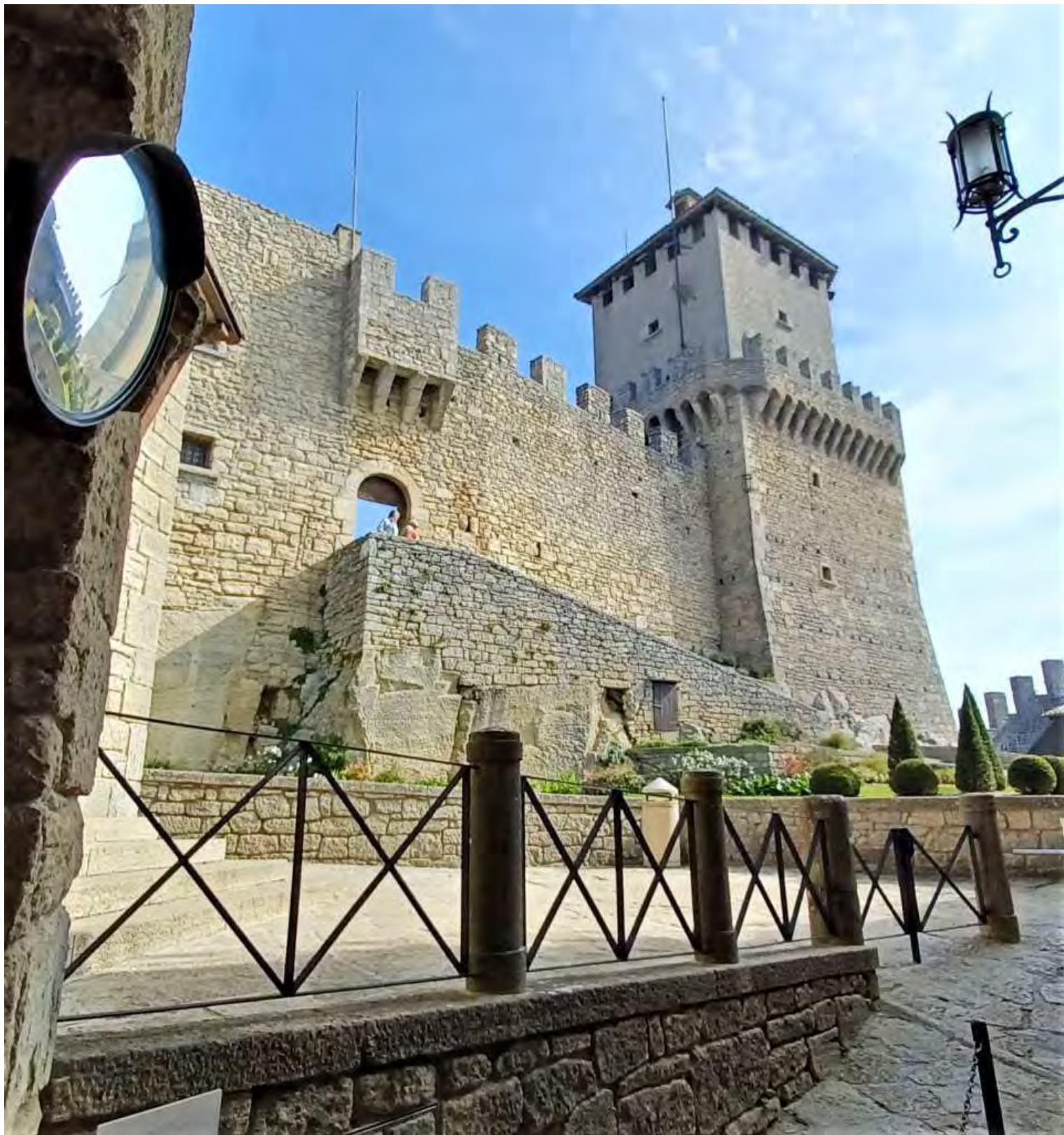
Una delle tre torri – fortezze sulle mura di cinta di San Marino