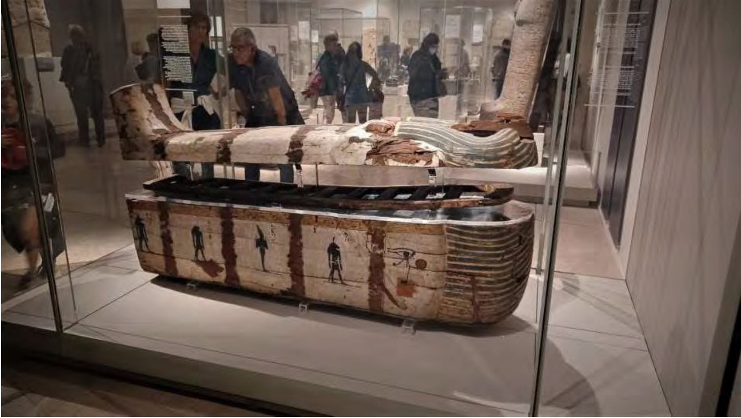
Poi vengono sagomati e dipinti con scorci di vita del defunto