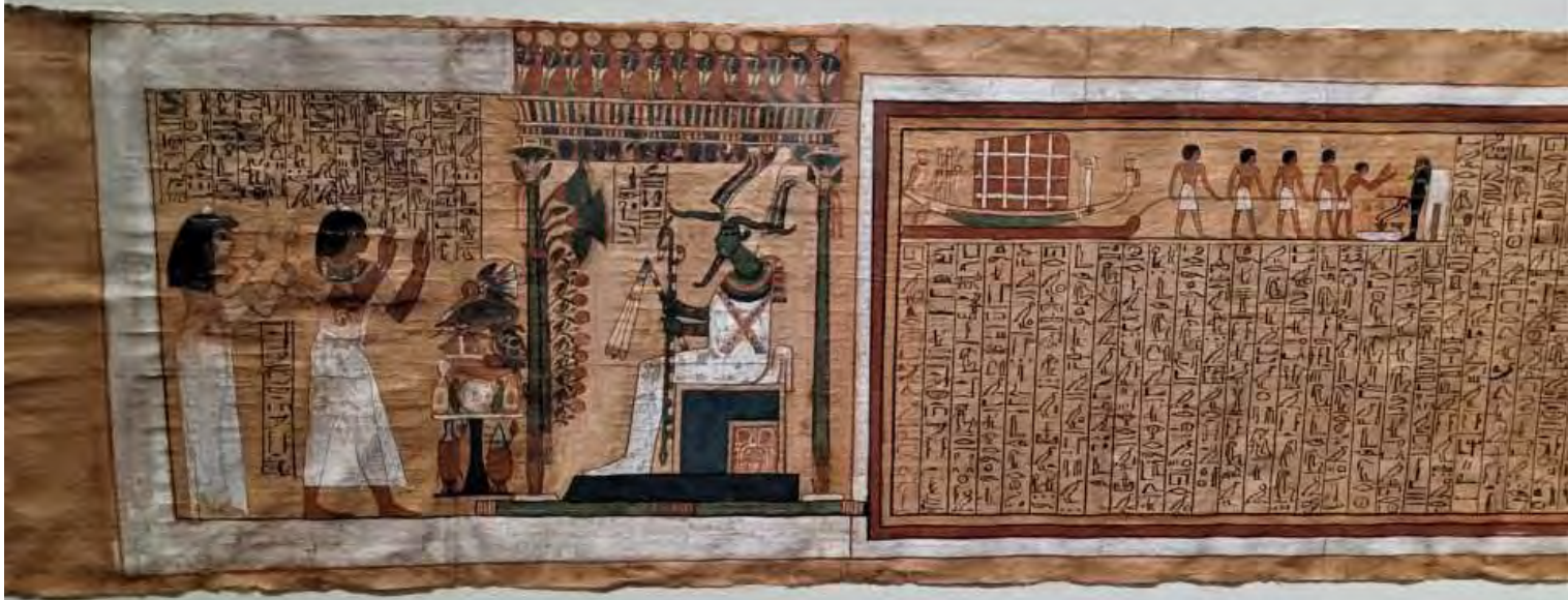
Libro dei morti, lungo anche decine di metri, fungeva da guida al defunto per raggiungere l'aldilà evitando i pericoli dell'oltretomba