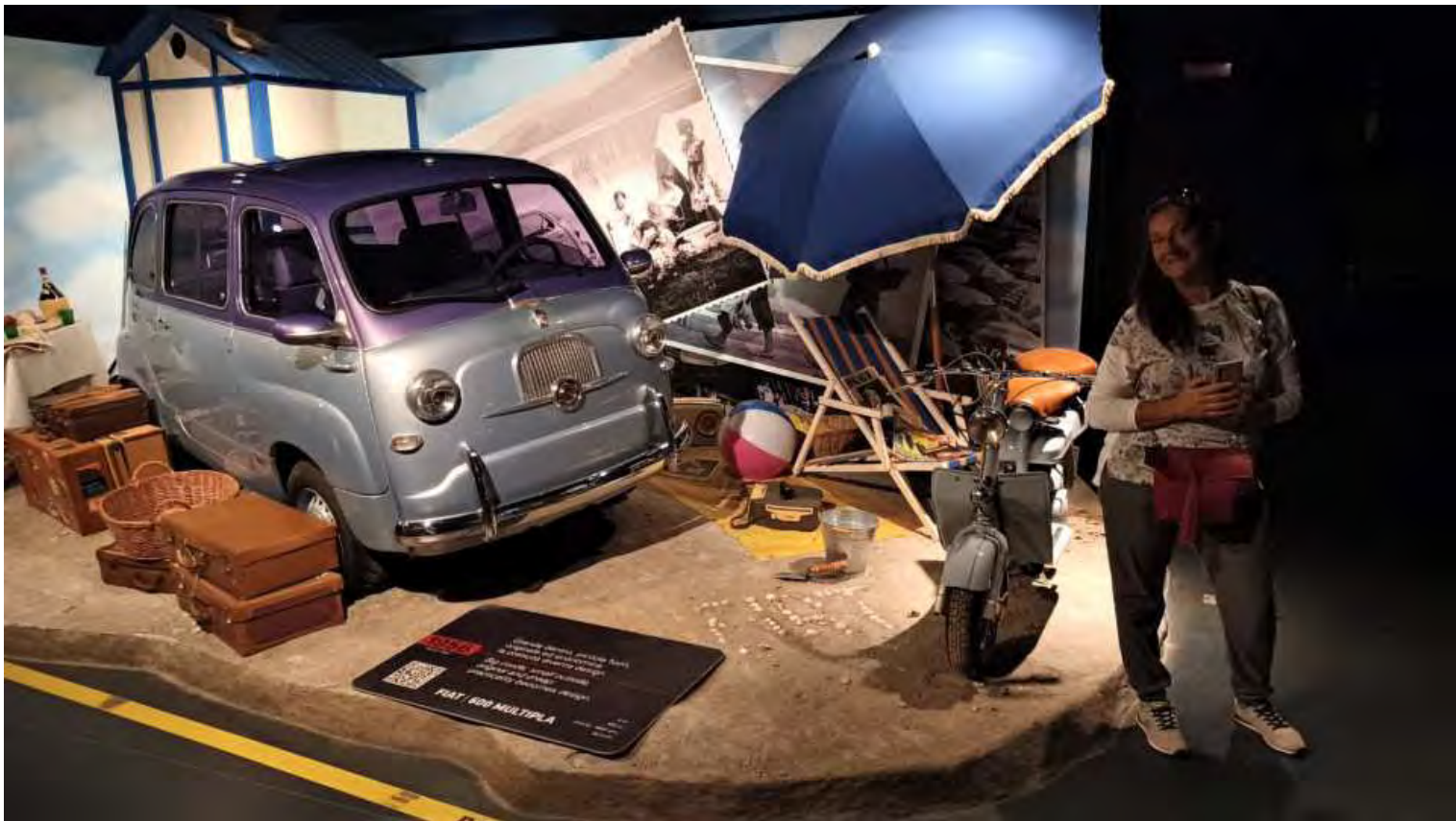
Alle più recenti ed utilitarie come la Fiat 600 Multipla del 1954