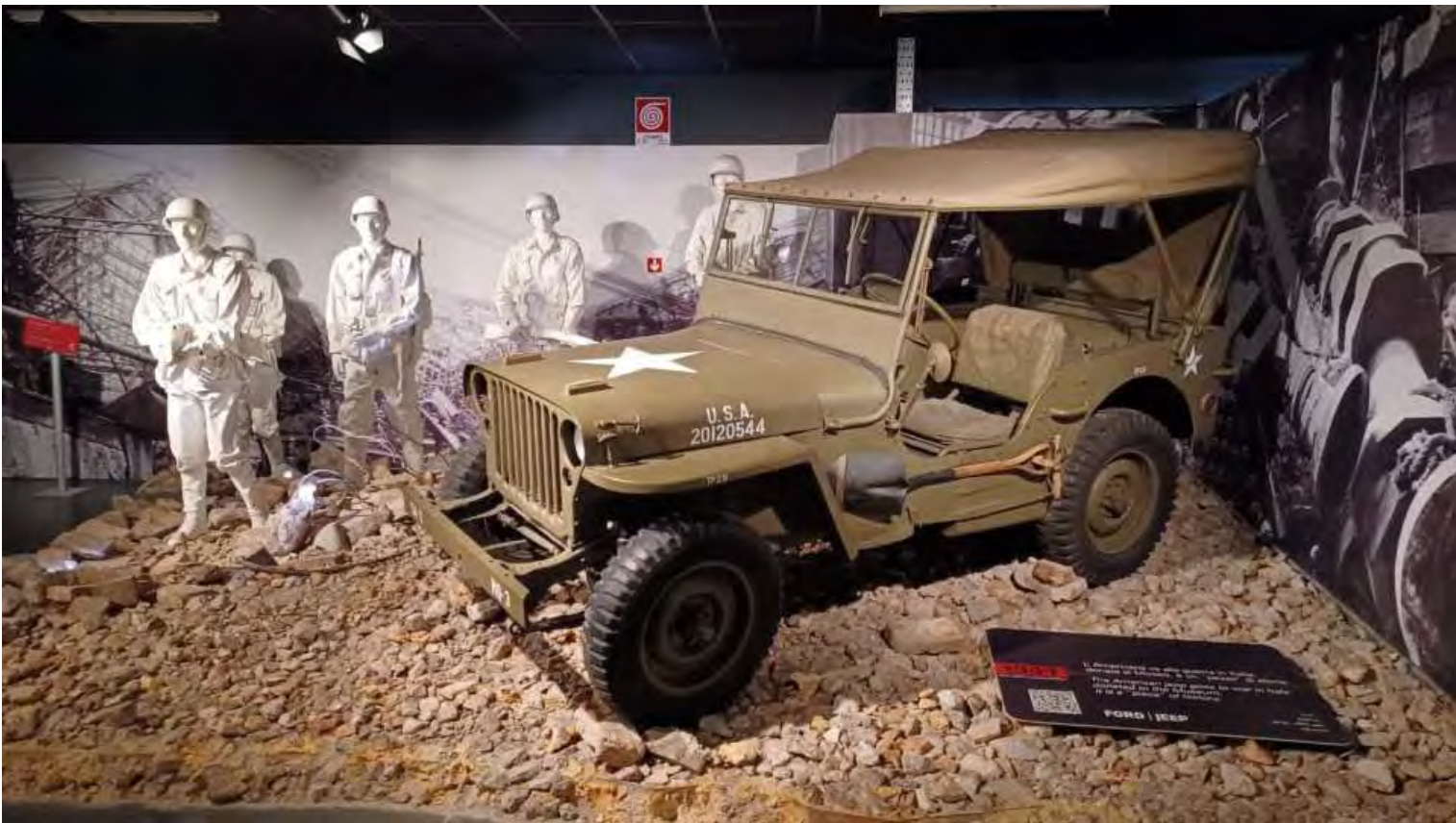
I veicoli che hanno conosciuto la guerra