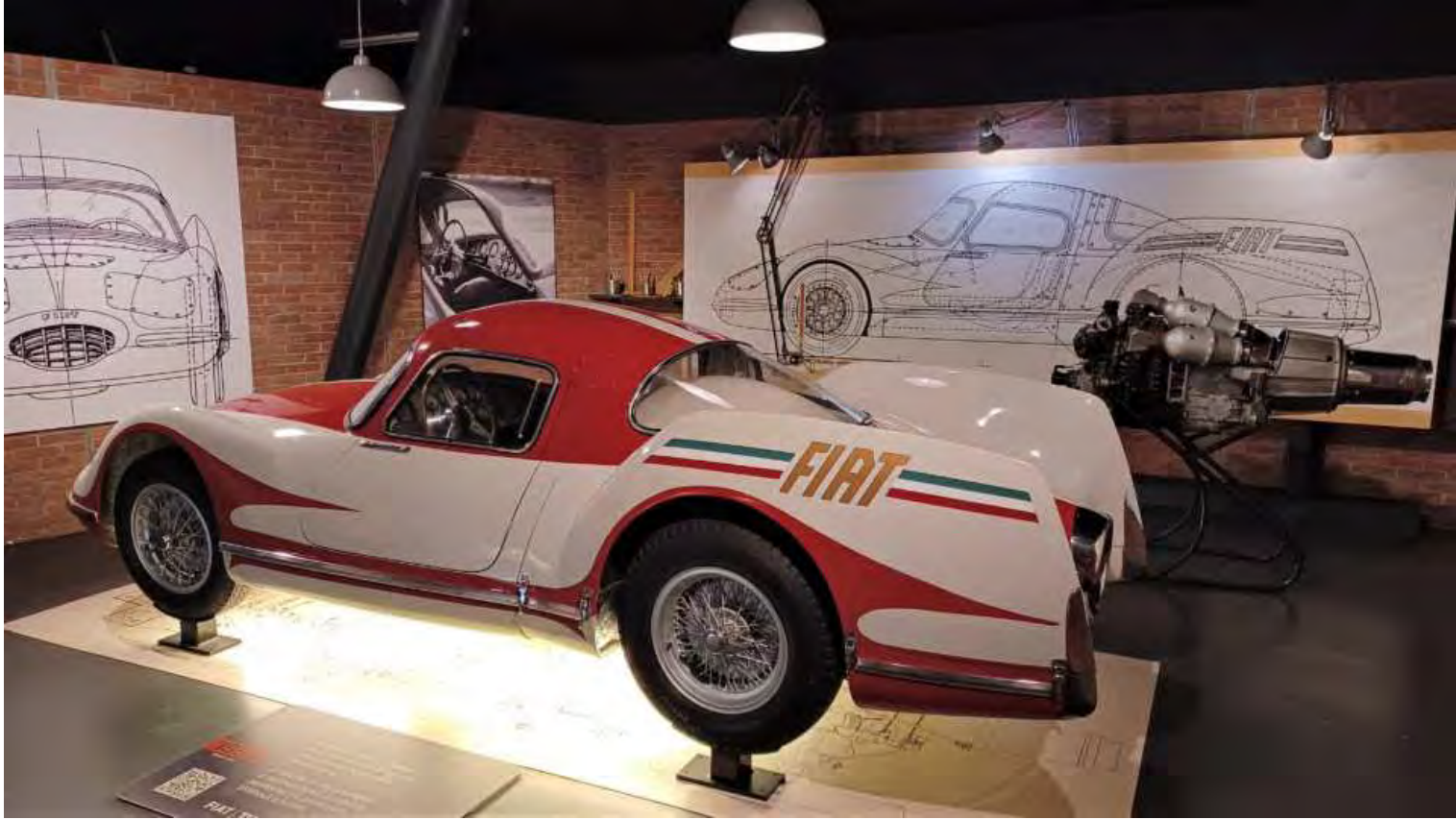
L'irraggiungibile auto a reazione con il suo motore sullo sfondo