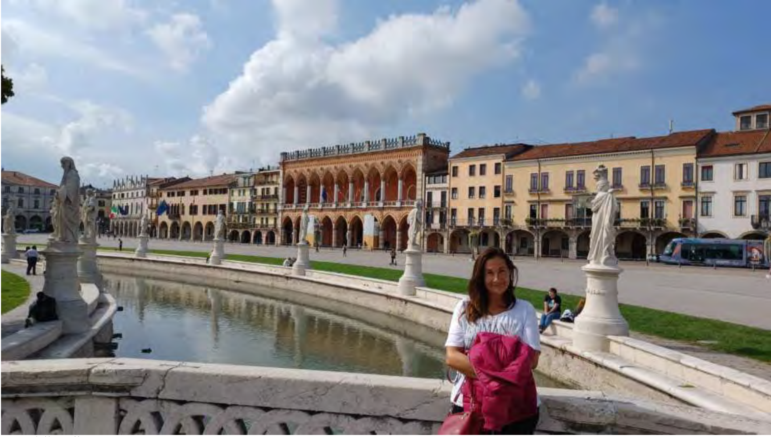
Prato della Valle