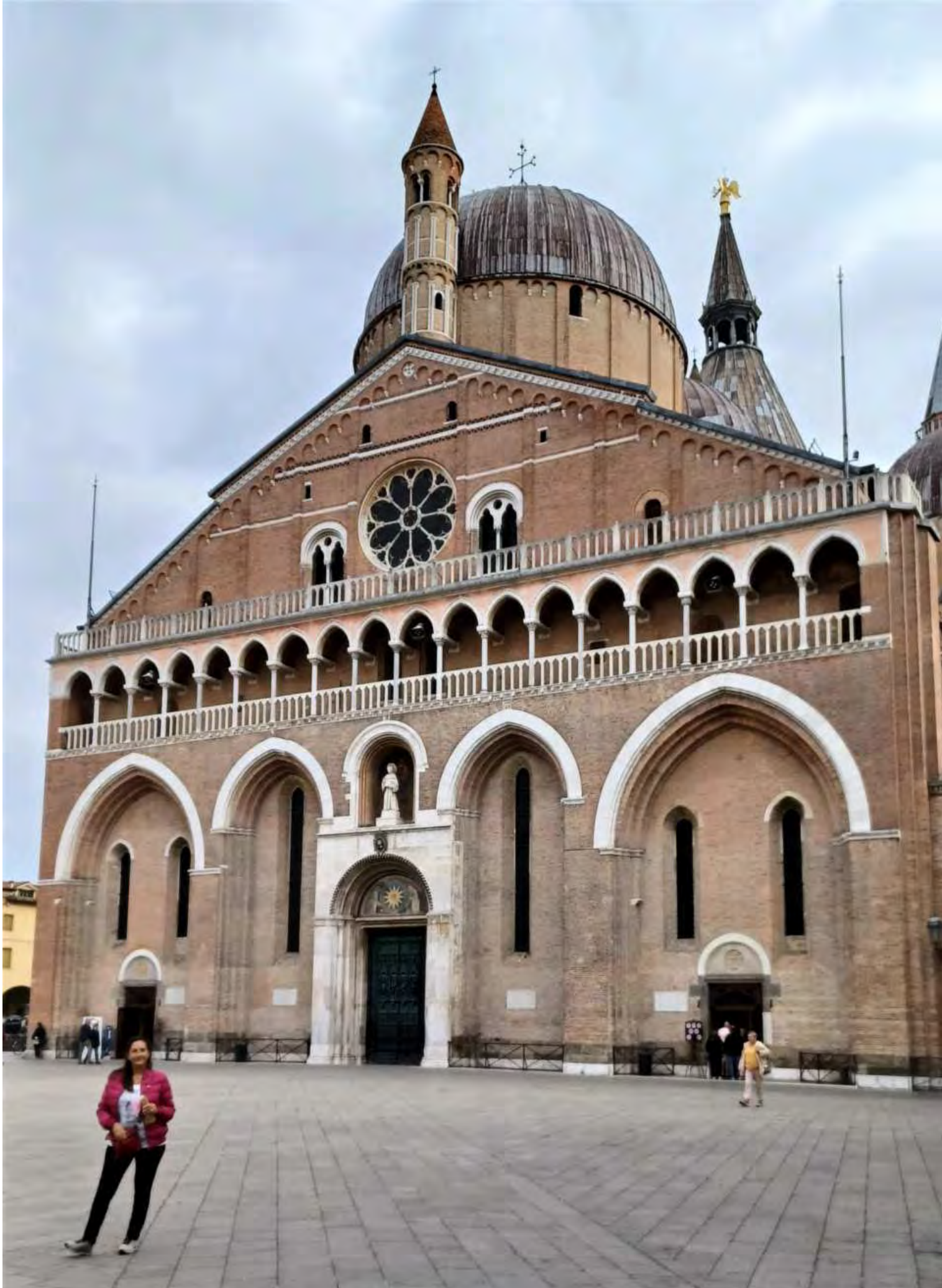
La Basilica Pontificia di Sant'Antonio, più comunemente conosciuta come Basilica del Santo o semplicemente "Il Santo", è una delle chiese più grandi del mondo. Al suo interno sono custodite le reliquie di Sant'Antonio e la sua tomba che può essere venerata dai fedeli in visita. La costruzione della Basilica ebbe inizio nel 1232, un anno dopo la morte del frate francescano Antonio nel luogo dove sorgeva la chiesa di Santa Maria che viene inglobata nella Basilica come cappella della Madonna Mora e terminò nel 1310. Accanto alla Basilica, si trova il convento francescano.