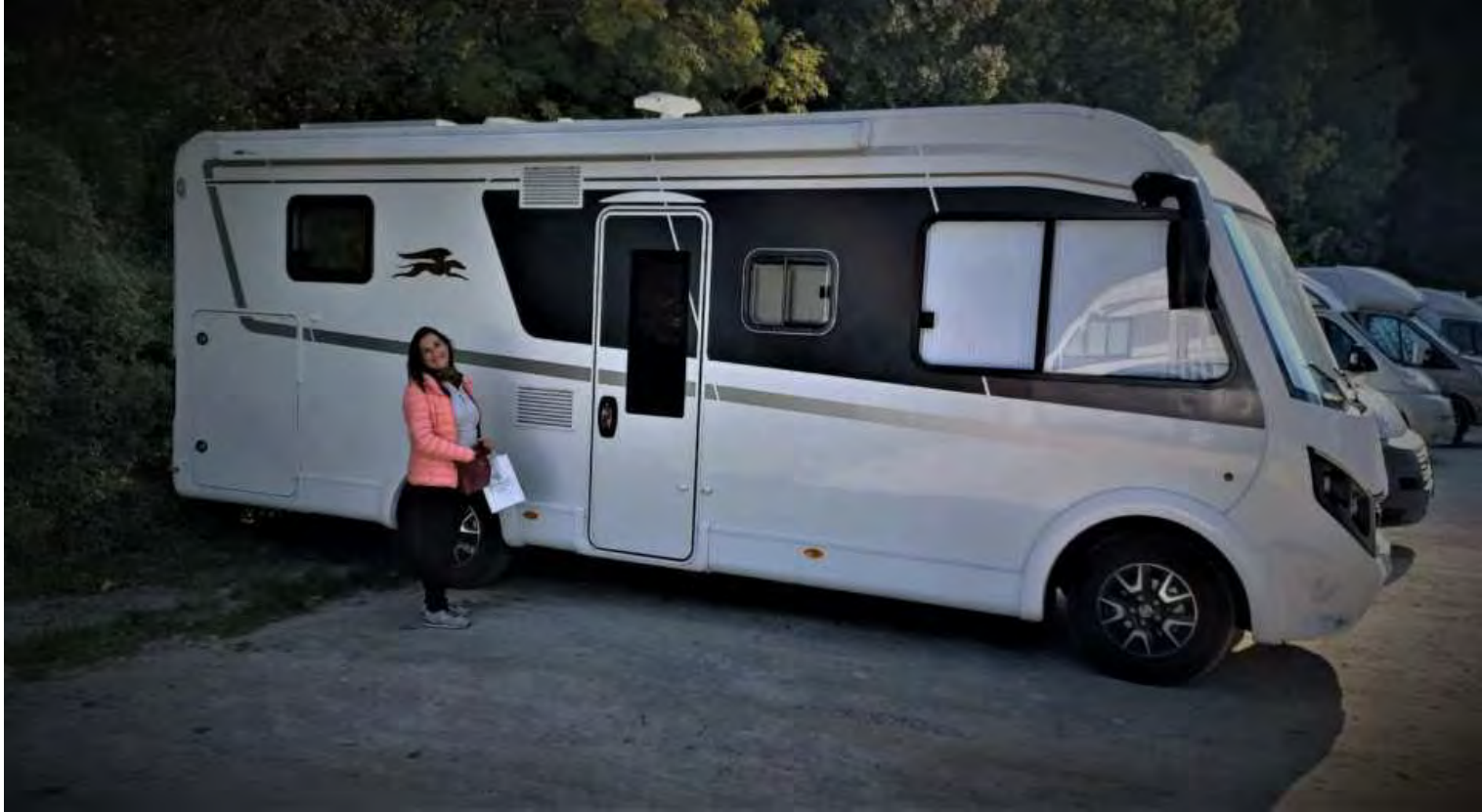
Il nostro Motorhome Laika

In totale abbiamo percorso 1,500 Km. Con un consumo medio di carburante di 9,3 litri per 100 Km. ed una spesa per pedaggio autostradale di circa 50 Euro