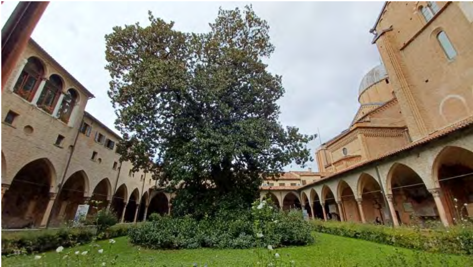
Chiostro della Magnolia