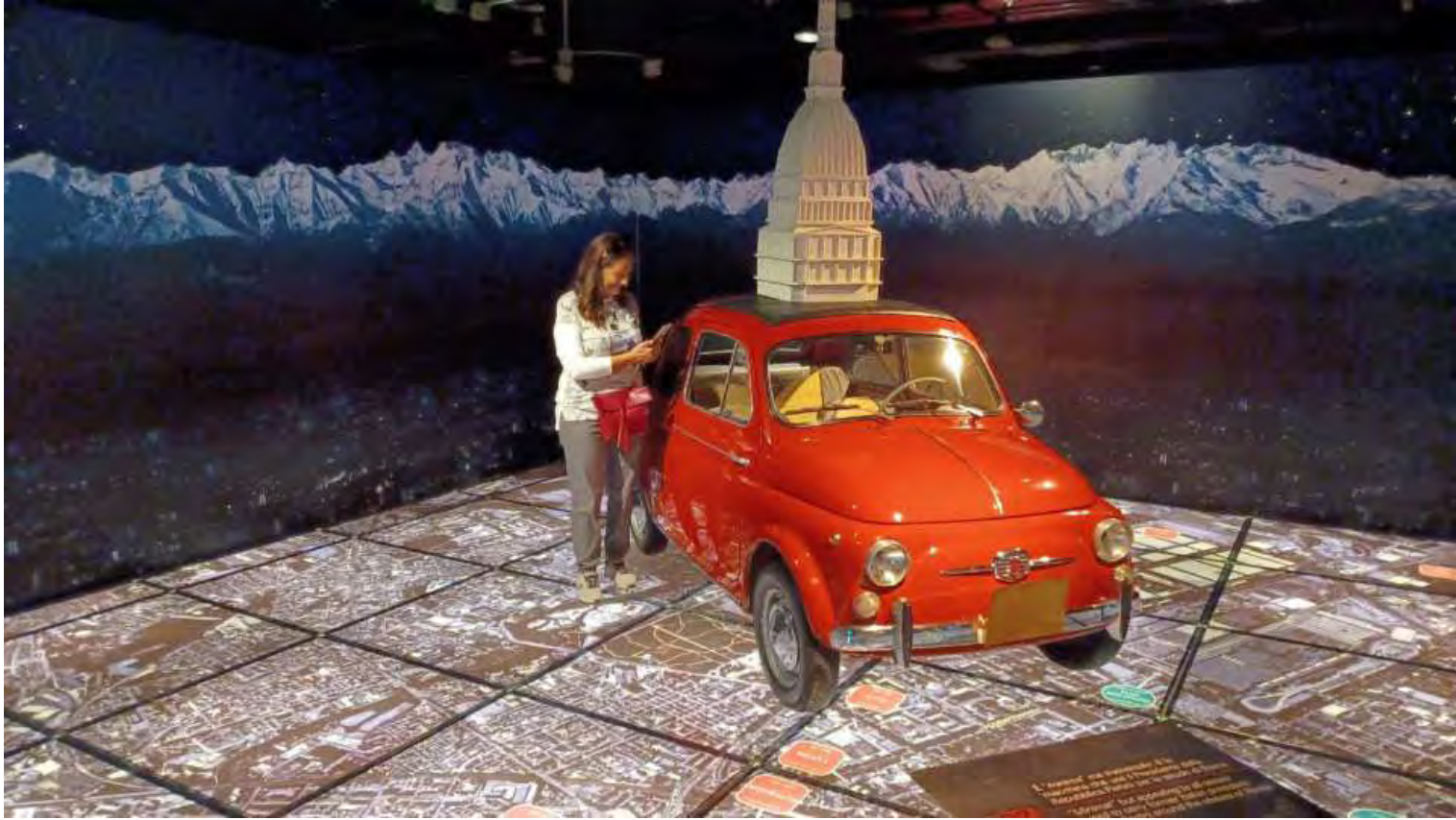
La Fiat 500 che fu di Sandro Pertini