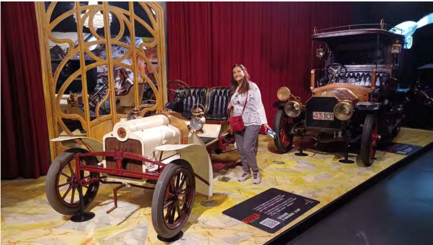
Alle più lussuose dei primi del '900