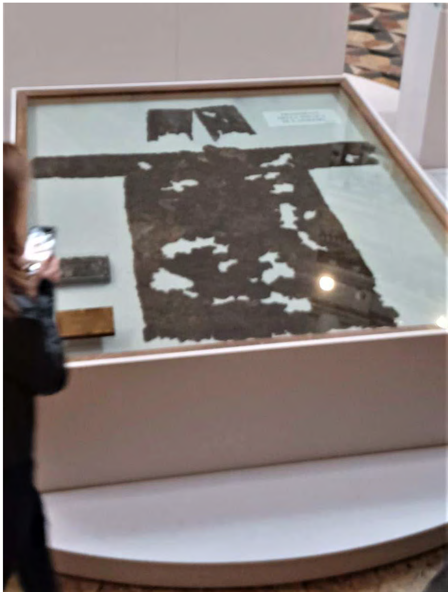
La veste di frate Antonio