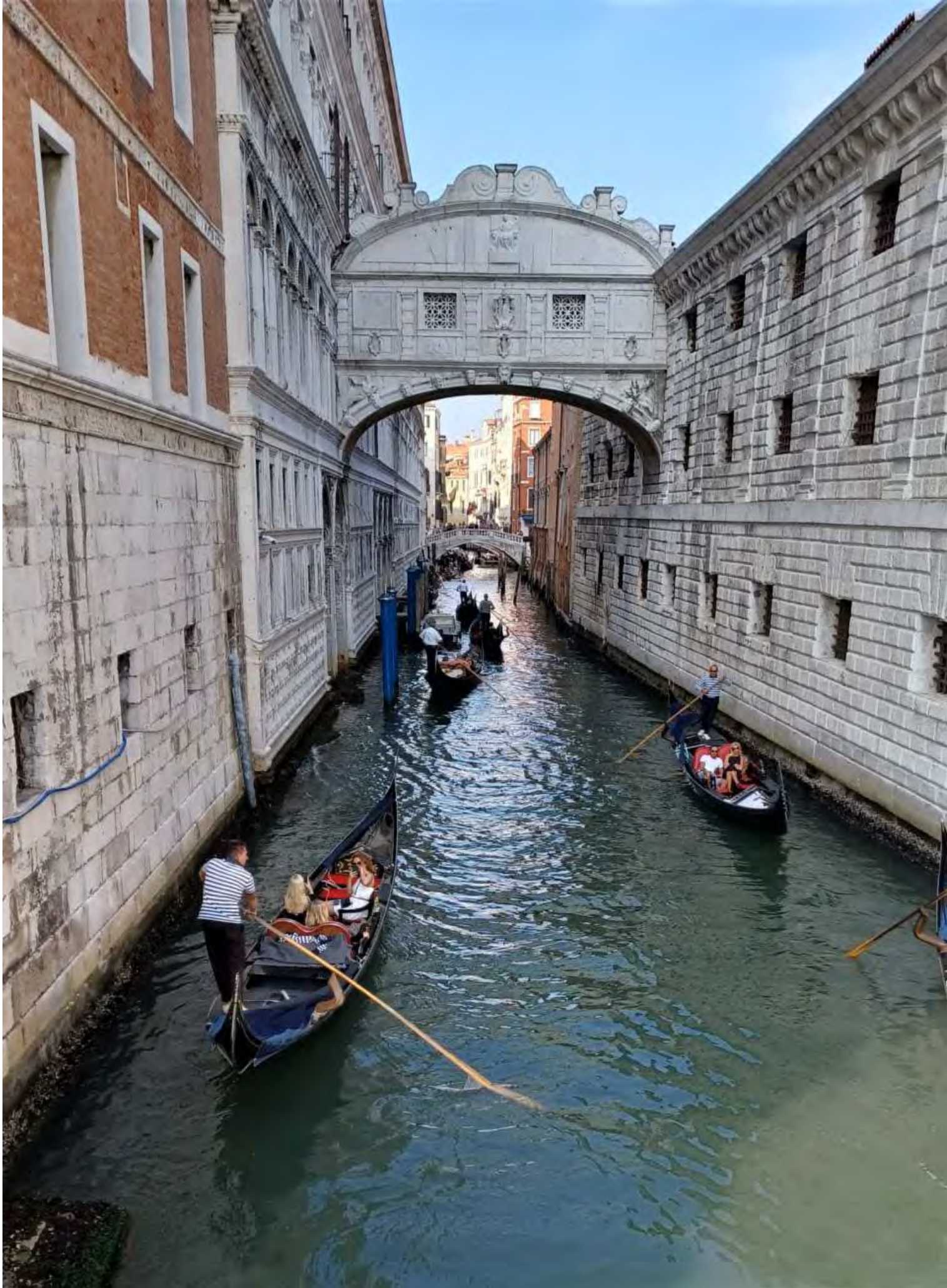
Uno dei canali con passaggio di Gondole