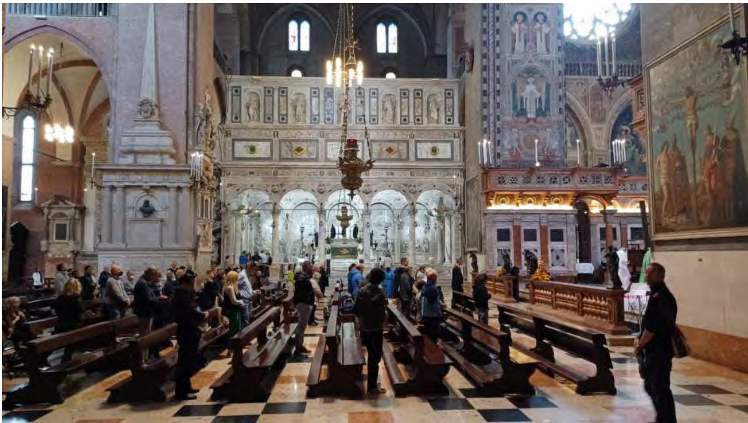
Fedeli in preghiera durante la messa e sullo sfondo la cappella dell'arca dove è custodita la tomba di Sant'Antonio