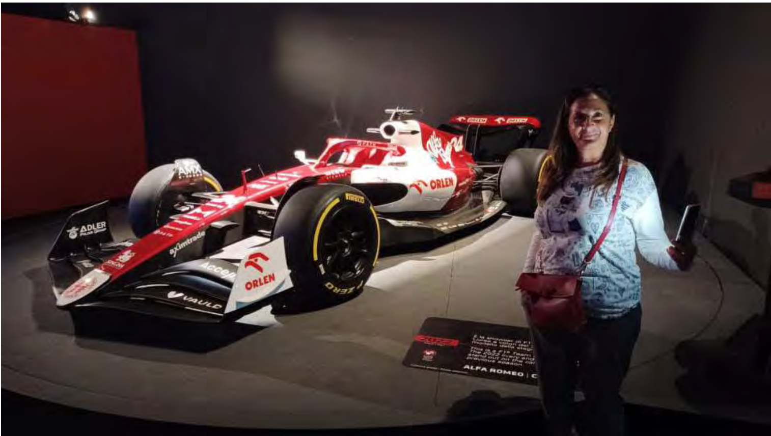
E le berline sportive degli anni nostri