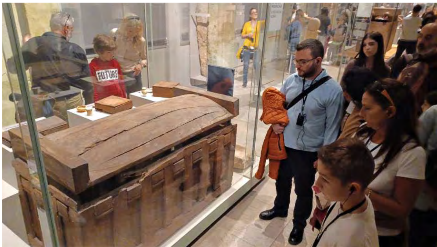
I primi Sarcofagi erano in legno e di fattura modesta, rappresentavano la casa del defunto